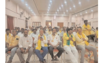
నందమూరి తారక రామారావు విగ్రహానికి పూలమాలలు వేసి ఘన నివాళులు అర్పించారు. అనంతరం మహానాడు కార్యక్రమాలలో తెలుగు తమ్ముళ్లు ఉత్సాహంగా పాల్గొన్నారు.