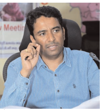
చేసినట్లు తెలిపారు. ఈ డెస్క్ ద్వారా పెట్టుబడిదారులు పరిశ్రమల స్థాపనకు అవసరమైన అనుమతులు, లైసెన్సులు, శాఖల సమన్వయం వంటి అంశాలలో సులభతర సేవలు అందించడంతో పాటు, వివిధ రకాల సేవలకు మార్గనిర్దేశనం చేయడం జరుగుతుందిన్నారు. పరిశ్రమల ఏర్పాటుకు అందుబాటులో ఉన్న