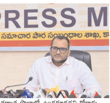
సమాచార పార సంబంధాల శాఖ, కాకినాడ