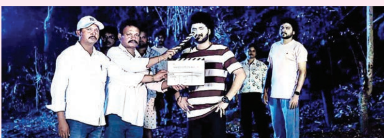
ప్రజాభూమి ప్రతినిధి - బుట్టాయగూడెం