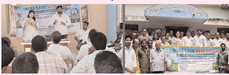
ప్రజాభూమి ప్రతినిధి - కాజులూరు

2026 ఖరీఫ్ సాగు కోసం మండలంలో రైతులంతా సమయాత్తం కావాలని కాజులూరు మండల వ్యవసాయ అధికారి వి. అశోక్ రైతులకు సూచించారు. ఈ మేరకు శుక్రవారం కాజులూరు మండల తిప్పరాజుపాలెం గ్రామంలో “ఖరీఫ్ 2026 - సాగుకు సమయాత్తం” శీర్షిక కింద వ్యవసాయ అధికారి వి. అశోక్ అధ్యక్షతన కేంద్రస్థాయిలో రైతులకు అవగాహన కార్యక్రమం ఏర్పాటు చేశారు. ఈ కార్యక్రమంలో ముఖ్యంగా ఈ ఖరీఫ్ సందల మిన్నో ప్రభావం ఉంటుంది అనే హెచ్చరిక మేరకు రైతులందరూ ఖరీఫ్ సాగుకు ఏ విధంగా సమయాత్తం కావాలనేది ముఖ్యంగా వివరించారు. ఈ మేరకు జూన్ 1వ తారీఖు నాటికి సాగునీరు అందుబాటులో ఉంటుందని కావున రైతులందరూ ముందస్తుగా పరి నారు వేసుకొని, జూన్ 15 నుండి 30వ తారీఖు లోపు వరి విత్తనాలు చల్లుకుని, నారుపట్టి సిద్ధం చేసుకోవాలని సూచించారు. అలాగే జూలై 31 నాటికి వరి నాట్లు పూర్తి చేయాలని, నాట్ల పద్ధతిలో ఊడ్డి విధానాన్ని అవలంబించాలని, రాయితి విత్తనాలు, యుక్త పరికరాలు మరియు మొదలైన వ్యవసాయ శాఖ ద్వారా అందించే వివిధ సమాచారాన్ని మొత్తం ఒకే మొబైల్ యాప్ అయినటువంటి ఏపీఎస్ ద్వారా రైతులు వారి స్వాగ్గ్ మొబైల్ ద్వారా తెలుసుకోవచ్చని తెలిపారు. రైతుల సాగుచేసిన విస్తీర్ణానికి మొత్తాన్ని ఓం ఎక్స్ వై పథకం ద్వారా ఇన్సూరెన్స్ నందు సమాధు చేసుకోవాలని సూచించారు. ఈ కార్యక్రమంలో భాగంగా ఎరువుల సమతుల్య వినియోగంపై భారతీయ పరి పరిశోధన సంస్థ తరఫున విచ్చేసిన సీనియర్ శాస్త్రవేత్త సిహెచ్ సువర్ణరాణి చే రైతులకు ఎరువుల వినియోగం మరియు మట్టి సమూహ పరీక్ష కోర్ట్ ఏ విధంగా వినియోగించాలని దానిపై అవగాహన కల్పిస్తూ లైవ్ డెమోను చూపించడం జరిగింది. ఈ కార్యక్రమంలో వ్యవసాయ విస్తరణ అధికారి, కాజులూరు సిహెచ్ ప్రకాష్, గ్రామ వ్యవసాయ సహాయకులు సత్యదేవి, సాహెబ్, సౌమ్య మరియు గ్రామ పెద్దలు, రైతులు పాల్గొన్నారు.