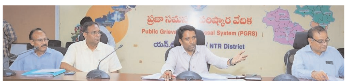
శ్రీ పింగళి వెంకయ్య సమావేశ మందిరంలో యూపీఎస్ఐ సివిల్స్ ప్రిలిమినరీ పరీక్షను నిర్వహణపై సమన్వయ సమావేశం నిర్వహించారు.