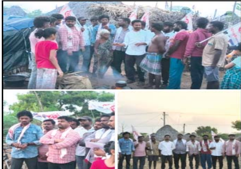
ప్రజా భూమి ప్రతినిధి - తొట్టంబేడు మండలం.