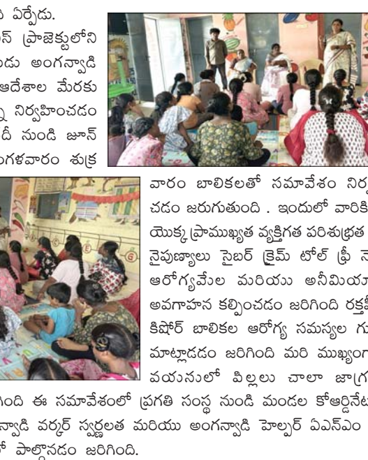
అంజిమేడు అంగన్వాడి సెంటర్ నందు కిశోర వికాసం కార్యక్రమాన్ని ఘనంగా నిర్వహించారు