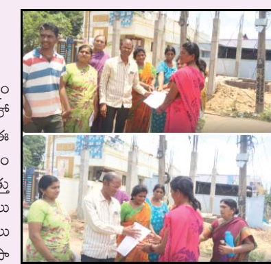
ప్రజా భూమి ప్రతినిధి, గూడూరు, నెల్లూరు జిల్లా గూడూరు రెండో వట్టు ఇందిరానగర్ లోని పోలయ్యగుంట రోడ్డులో నివాసాలు విద్యుత్ శాఖ రెండవ వట్టల ఏక గారికి దాదాపు 30 మంది ఏజెన్టీ విసత్తం ఇస్తూ గత ఆరు సంవత్సరాలుగా విద్యుత్తు పెచ్చుతగ్గుల సమస్యలతో మా గృహ వస్తువులు కాలిపోతున్నాయని గత ఆరు సంవత్సరాలుగా విద్యుత్ శ్రాస్థానం ఏర్పాటు చేయమని ఎన్నోసార్లు విద్యుత్ శాఖ వారికి విసత్తం అందించారు.

ప్రజా భూమి ప్రతినిధి, గూడూరు, నెల్లూరు జిల్లా గూడూరు రెండో వట్టు ఇందిరానగర్ లోని పోలయ్యగుంట రోడ్డులో నివాసాలు విద్యుత్ శాఖ రెండవ వట్టల ఏక గారికి దాదాపు 30 మంది ఏజెన్టీ విసత్తం ఇస్తూ గత ఆరు సంవత్సరాలుగా విద్యుత్తు పెచ్చుతగ్గుల సమస్యలతో మా గృహ వస్తువులు కాలిపోతున్నాయని గత ఆరు సంవత్సరాలుగా విద్యుత్ శ్రాస్థానం ఏర్పాటు చేయమని ఎన్నోసార్లు విద్యుత్ శాఖ వారికి విసత్తం అందించారు. గత 6 సంవత్సరాలుగా విద్యుత్ శాఖ వారికి విద్యుత్ శ్రాస్థానం కొత్తది ఏర్పాటు చేయమని ఎన్నోసార్లు విసత్తం అందించామని కానీ విద్యుత్ శాఖ వారి నుండి ఎలాంటి స్పందన రానందున నేడు కొత్తగా వచ్చిన ఏజెన్టీ తీసుకుని వెళ్ళగా ఆయన స్పందించి ఇందిరా నగర్ లో పోలయ్యగుంట రోడ్ లో ఎక్కడ డ్రాస్టర్ ఏర్పాటు చేయాలో సిబ్బందితో వచ్చి పరిశీలించడం జరిగింది త్వరలో ఇక్కడ విద్యుత్ శ్రాస్థానం ఏర్పాటు చేస్తామని ఏజెన్టీ కలకులకు హామీ ఇవ్వడం జరిగింది