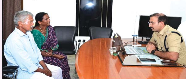
చిత్తూరు జిల్లా పోలీసు కార్యాలయంలో సోమవారం నిర్వహించిన "ప్రజా ఫిర్యాదుల పరిష్కారం" కార్యక్రమంలో జిల్లా నలుమూలల నుంచి వచ్చిన ప్రజల నుంచి మొత్తం 39 ఫిర్యాదులు స్వీకరించారు.