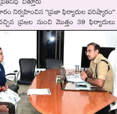
చిత్తూరు జిల్లా పోలీసు కార్యాలయంలో సోమవారం నిర్వహించిన "ప్రజా ఫిర్యాదుల పరిష్కారం" కార్యక్రమంలో జిల్లా నలుమూలల నుంచి వచ్చిన ప్రజల నుంచి మొత్తం 39 ఫిర్యాదులు స్వీకరించారు.