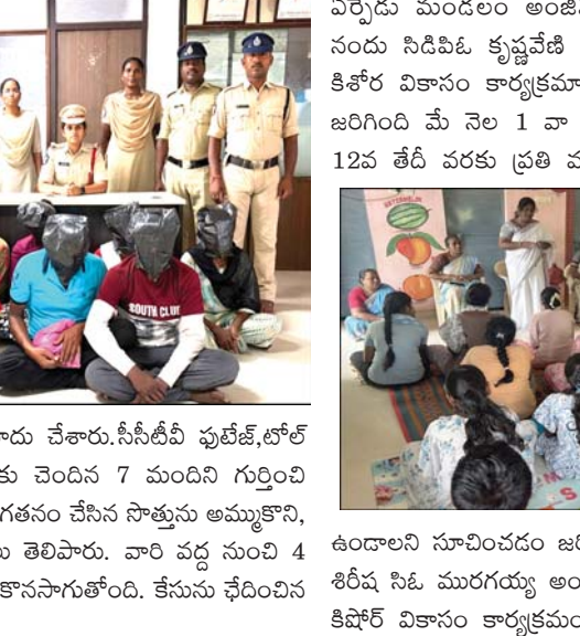
అంజిమేడు అంగన్వాడి సెంటర్ నందు కిశోర వికాసం కార్యక్రమాన్ని ఘనంగా నిర్వహించారు