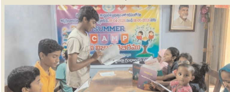
ప్రజా భూమి ప్రతినిధి-ఆగిరిపల్లి

ఆగిరిపల్లి శాఖ గ్రంథాలయంలో నిర్వహిస్తున్న వేసవి విజ్ఞాన శిబిరంలో శనివారం విద్యార్థులకు పుస్తక పఠన కార్యక్రమం నిర్వహించారు. చిన్నారులు కథలు, బాలసాహిత్యం, సాధారణ విజ్ఞాన పుస్తకాలు, వార్తాపత్రికలు చదివి తమ జ్ఞానాన్ని పెంపొందించుకున్నారు. విద్యార్థుల్లో పఠనాసక్తి పెంచడం, విజ్ఞానాన్ని అభివృద్ధి చేయడం, వేసవి సెలవులను సద్వినియోగం చేసుకునేలా చేయడమే శిబిరం ప్రధాన ఉద్దేశమని గ్రంథాలయ అధికారి కుమార్ తెలిపారు. కార్యక్రమంలో విద్యార్థులు, పాఠకులు, గ్రంథాలయ సిబ్బంది పాల్గొన్నారు.