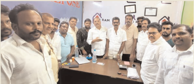
ప్రజా భూమి ప్రతినిధి, కామవరపుకోట