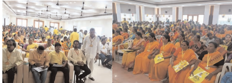
ముగింపు ఉత్సవం రోజున పార్టీ శ్రేణులు పెద్ద ఎత్తున తరలివచ్చారు. అధిక సంఖ్యలో మహిళానాయకురాలు పనులు చేరారు, పురుషులు పనులు చేయడం మారినది.

ప్రజా భూమి ప్రతినధి-ఆగిరిపల్లి ఆగిరిపల్లి మండలం వ్యాప్తంగా ముస్లిం సోదరులు బక్రీడ్ పండుగను భక్తి తల్లలతో జరుపుకున్నారు. ఉదయం ఉదా పర్వ ప్రత్యేక ప్రార్థనలు నిర్వహించి, మత పెద్దల సందేశాలను ఆలించారు. అనంతరం తమ పూర్వీకుల సమాధుల వద్ద ప్రార్థనలు చేసి, సంప్రదాయం ప్రకారం కుర్బానీ నిర్వహించారు. త్యాగానికి ప్రతీకగా భావించే ఈ పండుగ సందర్భంగా పేదలకు, బంధువులకు మానాన్ని పంచిపెట్టి సోదరభావాన్ని చాటుకున్నారు. ఒకరినొకరు ఆగిరిగనం చేసుకుంటూ బక్రీడ్ శుభాకాంక్షలు తెలియజేసుకున్నారు.