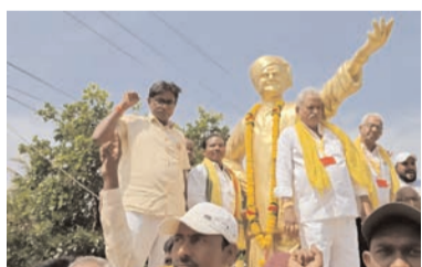
య నందమూరి తారక రామారావు వేసిన కొనియాడారు. పేదల అభ్యున్నతికి పలు పథకాలను ప్రవేశపెట్టిన ఘనత ఆయనకే దక్కిందన్నారు. మారుమూల ప్రాంతాలకు నిలువని ఘనత ఎన్టీఆర్ దేసిన, ఈ విధంగా ఆయన చేసిన ప్రజా ఆమోద కార్యక్రమాలను గుర్తు చేసుకున్నారు. అనంతరం పార్టీ కార్యాలయం వద్ద వర్చువల్ మహానాడు కార్యక్రమానికి ఎన్టీఆర్ జయంతి వేడుకలకు సంయుక్తంగా పాల్గొన్న పార్టీ శ్రేణులు అందరికీ భోజన వసతిని కల్పించారు. ఈ కార్యక్ర