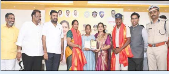
ప్రజాభూమి ప్రతినిధి: శ్రీకాళహస్తి టౌన్