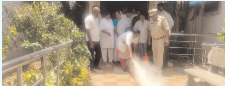
ప్రజా భూమి ప్రతినిధి-ఆగిరిపల్లి

ప్రాథమిక ఆరోగ్య కేంద్ర సిబ్బందికి అవగాహన శిక్షణ