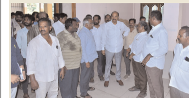
ప్రజా భూమి ప్రతినిధి-ఆగిరిపల్లి

కార్యక్రమాల అన్ని సౌకర్యాలు కల్పించాలని మంత్రి కొలుసు హర్షారావు నూచన