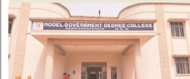
ప్రజా భూమి ప్రతినిధి-కామవరపుకోట

స్థానిక కామవరపుకోట ప్రభుత్వ డిగ్రీ కళాశాలలో 2026-27 విద్యా సంవత్సరానికి జూన్ 1 వ తేదీ నుండి అడ్మిషన్స్ కొరకు దరఖాస్తులు స్వీకరిస్తున్నట్లు ప్రెస్ నోట్ ద్వారా తెలిపారు. కళాశాలలో బి.ఎ (పాలిటికల్ సైన్స్), బి.ఎ (ఎకనామిక్స్) బి.కాం (కంప్యూటర్ అప్లికేషన్స్), బి.ఎస్సీ (జూలజీ) హాస్పిట్ కోర్సులు అందుబాటులో ఉన్నాయని ఏలూరు జిల్లాలో ఎంతో విశిష్టతను కలిగి విద్యార్థులు సమగ్ర అభివృద్ధిని రక్షిస్తూ ఉంచుకొని ఆనంద అవగాహన కార్యక్రమాల నిర్వహించడంతో పాటు ఎన్నో మౌలిక వసతులతో కూడి ముఖ్యంగా మహిళలకు కళాశాల ప్రాంగణంలోనే ఉచిత హాస్టల్ సదుపాయం ఉందని తెలియజేశారు. ఇంటర్మీడియట్ ఉత్తీర్ణత పొందిన విద్యార్థులు ఈ అవకాశాన్ని వినియోగించుకోవాలని ప్రెస్ నోట్ ద్వారా తెలియజేశారు.