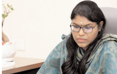
ప్రజా భూమి ప్రతినిధి-ఏలూరు