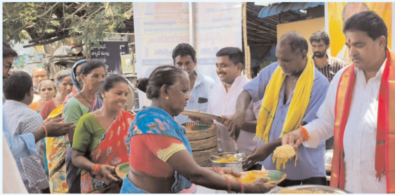
ప్రజా భూమి ప్రతినిధి-ఏలూరు

శ్రీ దాసాంజనేయ స్వామి ఆలయంలో మహా అన్న సమారాధన