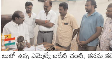
ప్రజా భూమి ప్రతినిధి-ఏలూరు