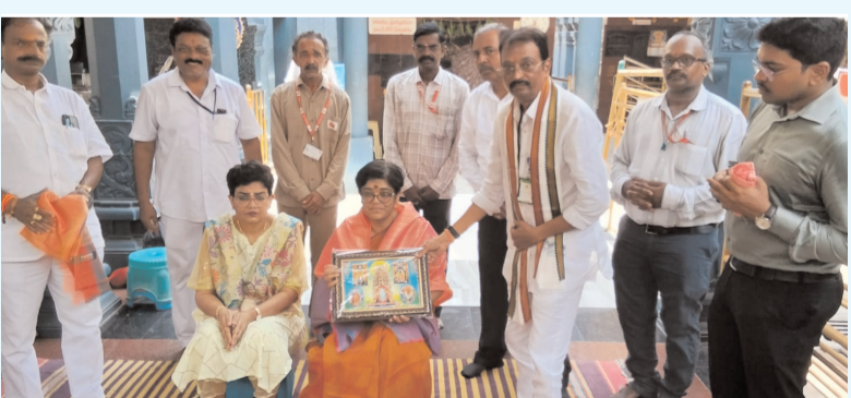
ప్రజా భూమి ప్రతినిధి-పాలకొల్లు

పోస్టల్ చీఫ్ పోస్ట్ మాస్టర్ జనరల్ బిపి శ్రీదేవి