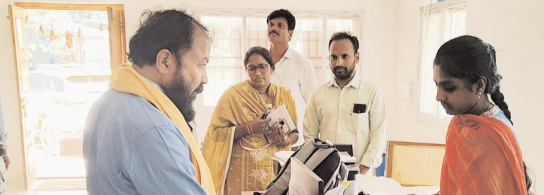
ప్రజాభూమి ప్రతినిధి - పెడవేగి

ప్రజలకు మెరుగైన సేవలు అందించాలనే లక్ష్యంతో దెందులూరు ఎమ్మెల్యే చింతమనేని ప్రభాకర్ శుక్రవారం పెడవేగి మండలంలోని రామలింగవరం, కూచింపూడి గ్రామ సచివాలయాలను ఆకస్మికంగా సందర్శించారు. సచివాలయంలో సిబ్బంది హాజరు, రికార్డులను పరిశీలించి విధుల్లో అలసత్వం ప్రదర్శించవద్దని సూచించారు. సిబ్బంది సమయపాటు పాటిస్తూ ప్రజలకు అందుబాటులో ఉండాలని, గ్రామ సమస్యల పరిష్కారంలో కొరత చూపాలని ఎమ్మెల్యే ఆదేశించారు. రాష్ట్ర ప్రభుత్వం చేపట్టిన జనగణన సర్వేను పూర్తి నిబద్ధతతో నిర్వహించాలని సిబ్బందికి సూచించారు. సచివాలయాలకు వచ్చిన ప్రజలతో నేరుగా మాట్లాడిన ఎమ్మెల్యే, అధికారులకు నిర్ణీత సమయంలో సేవలు అందేలా చర్యలు తీసుకోవాలని అధికారులను ఆదేశించారు. ఈ కార్యక్రమంలో అధికారులు, స్థానిక కూలమి నాయకులు, సచివాలయ సిబ్బంది పాల్గొన్నారు.