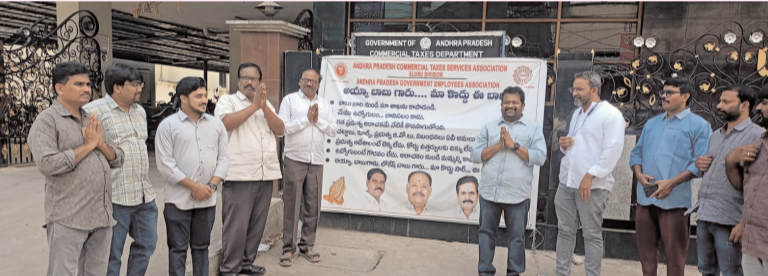
ప్రజాభూమి ప్రతినిధి - ఏలూరు

"అమ్మాద్ బాబు బారి నుంచి మా శాఖను కాపాడండి" అంటూ ఆందోళన