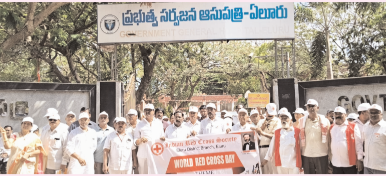
ప్రజాభూమి ప్రతినిధి - ఏలూరు