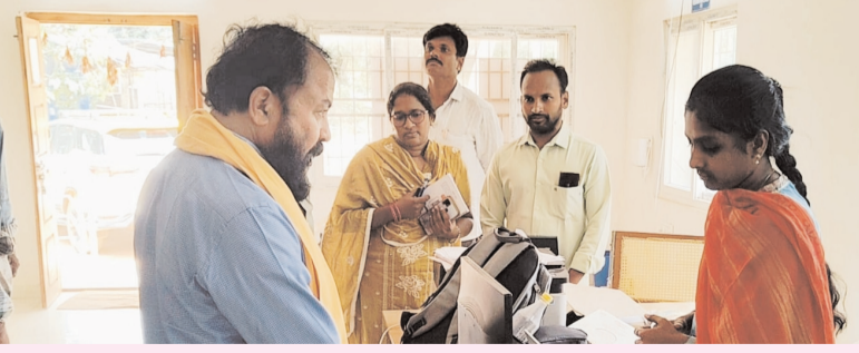
ప్రజాభూమి ప్రతినిధి - పెడవేగి

ప్రజలకు మెరుగైన సేవలు అందించాలనే లక్ష్యంతో దెందులూరు ఎమ్మెల్యే చింతమనేని ప్రభాకర్ శుక్రవారం పెడవేగి మండలంలోని రామలింగవరం, కూచింపూడి గ్రామ సచివాలయాలను ఆకస్మికంగా సందర్శించారు. సచివాలయంలో సిబ్బంది హాజరు, రికార్డులను పరిశీలించి విధుల్లో అలసత్వం ప్రదర్శించడంపై సూచించారు. సిబ్బంది సమయపాటు పాటిస్తూ ప్రజలకు అందుబాటులో ఉండాలని, గ్రామ సమస్యల పరిష్కారంలో చొరవ చూపాలని ఎమ్మెల్యే ఆదేశించారు. రాష్ట్ర ప్రభుత్వం చేపట్టిన జనగణన సర్వేను పూర్తి నిబద్ధతతో నిర్వహించాలని సిబ్బందికి సూచించారు. సచివాలయాలకు వచ్చిన ప్రజలతో నేరుగా మాట్లాడిన ఎమ్మెల్యే, అధికారులకు నిర్దిష్ట సమయంలో సేవలు అందించేలా చర్యలు తీసుకోవాలని అధికారులను ఆదేశించారు. ఈ కార్యక్రమంలో అధికారులు, స్థానిక కల్యాణి నాయకులు, సచివాలయ సిబ్బంది పాల్గొన్నారు.