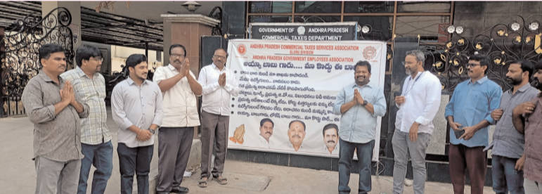
ప్రజాభూమి ప్రతినిధి - ఏలూరు

"అమ్మాద్ బాబు బారి నుంచి మా శాఖను కాపాడండి" అంటూ ఆందోళన