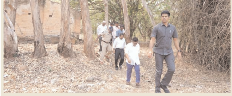
ప్రజా భూమి ప్రతినిధి-రాజమహేంద్రవరం

కేంద్ర, రాష్ట్ర ప్రభుత్వాల సమన్వయంతో పర్యాటక ప్రగతి మారంపూడి లోని ప్రభుత్వ స్థలాలను పరిశీలించిన మంత్రి