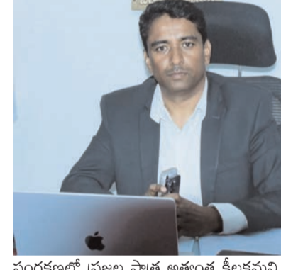
సంరక్షణలో ప్రజల పాత్ర అత్యంత కీలకమని, ప్రతి ఒక్కరూ వర్షపు నీటిని వృథా కాకుండా వినూత్న విధానాలను ఆచరించాలని సూచించారు. పర్యావరణ పరిరక్షణలో భాగంగా నీటి వనరులను కాపాడకోవడం ప్రతి పౌరుడి బాధ్యత అని స్పష్టం చేశారు. జలధార కార్యక్రమం ద్వారా జిల్లాలో నీటి భద్రతకు, నీటి సమస్యలకు డీర్ఘకాలిక

సామర్థ్యాన్ని పెంపొందించేందుకు జలధార కింద వివిధ కార్యక్రమాలు చేపట్టడం జరుగుతోందన్నారు. ఫీడర్ ఛానళ్లు, చెరువుల్లో పూడిక తీతతో పాటు వివిధ పనులు చేపట్టడం జరుగుతోందన్నారు. స్వయం మరమ్మత్తులు, ఫీడర్ ఛానళ్ల అభివృద్ధి పంటివాటిపై దృష్టిసారీస్తున్నట్లు తెలిపారు. భూగర్భ జలాల పెంపు లక్ష్యంగా వర్షపు నీటిని సమర్థంగా నిల్వ చేసేందుకు రీచార్జ్ పిట్స్, పర్మాటేషన్ ట్యాంకుల నిర్మాణం, పాత జలవనరుల పునరుద్ధరణపై ప్రత్యేకంగా దృష్టిసారీస్తున్నామని పేర్కొన్నారు. గ్రామ స్థాయిలో ప్రజల భాగస్వామ్యంతో ఈ కార్యక్రమాన్ని విజయవంతం చేయనున్నట్లు తెలిపారు. ఇరిగేషన్, పంచాయతీరాజ్, గ్రామీణ అభివృద్ధి, మున్సిపల్, వ్యవసాయ తదితర శాఖలు సమన్వయంతో పనిచేయాలని ఇప్పటికే మార్గదర్శకాలు ఇచ్చినట్లు వివరించారు. నీటి