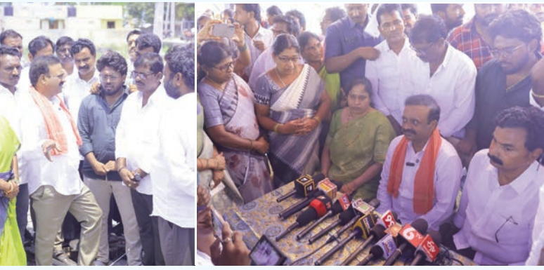
మచిలీపట్నం, (ప్రజాభూమి బ్యూరో కృష్ణాజిల్లా)