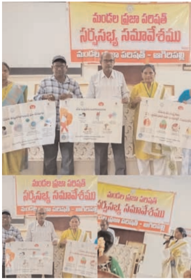
ప్రజా భూమి ప్రతినిధి-ఆగిరిపల్లి