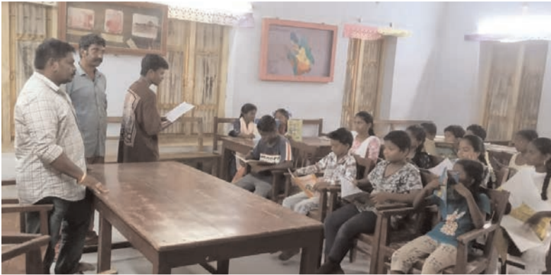
ప్రజా భూమి ప్రతినిధి-పెదపాడు