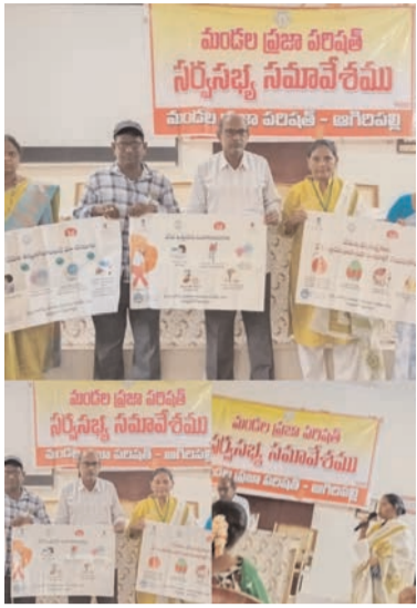
ప్రజా భూమి ప్రతినిధి-ఆగిరిపల్లి