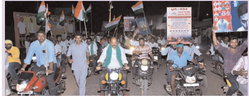
ప్రజా భూమి ప్రతినిధి-ఆగిరిపల్లి