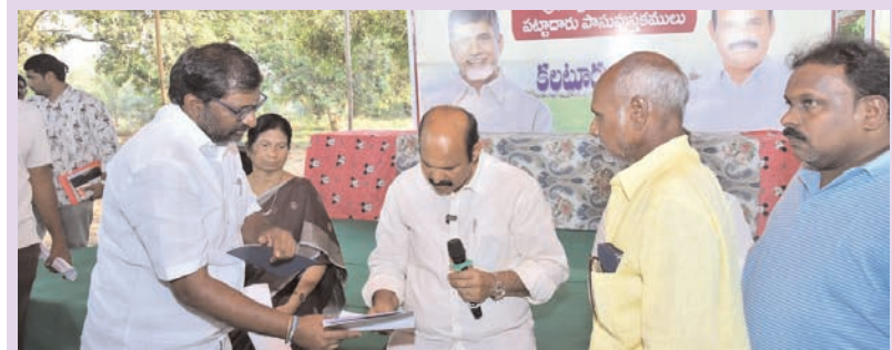
ప్రజా భూమి ప్రతినిధి - ఆగిరిపల్లి

ఫిర్యాదుదారులను పడేపడే రద్దీ కలిసే చర్యలు