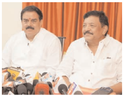
సేకరణ చేపట్టి రూ.11,300 కోట్ల రూపాయలు రైతుల ఖాతాల్లో కేవలం 24 గంటల్లోనే జమ చేశామని గుర్తుచేశారు. అందులో సుమారు రూ.7300 కోట్ల రూపాయలు కేవలం 8 గంటల్లోనే రైతుల ఖాతాల్లో జమ చేశామన్నారు. రైతులు హర్షించడం తమకు సంతోషం కలిగించిందన్నారు.

ప్రజాభూమి ప్రతినిధి - నిడదవోలు రైతుల సంక్షేమమే ధ్యేయంగా కూటమి ప్రభుత్వం రబీ ధాన్యం సేకరణకు అన్ని ఏర్పాట్లు పూర్తి చేసిందని రాష్ట్ర పౌర సరఫరా శాఖ మంత్రి నాదెండ్ల మనోహర్, పర్యాటక శాఖ మంత్రి కందుల దుర్గేష్ సంయుక్తంగా ప్రకటించారు. శుక్రవారం నిడదవోలులోని మంత్రి క్యాంపు కార్యాలయంలో నిర్వహించిన మీడియా సమావేశంలో వారు మాట్లాడారు.