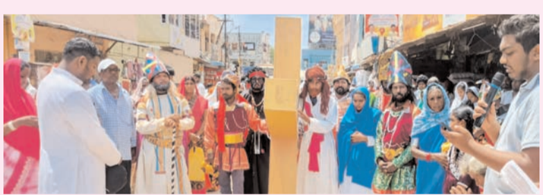
ప్రజా భూమి ప్రతినిధి-ఆగిరిపల్లి