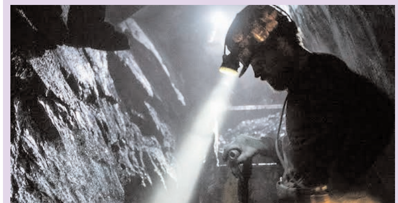
ప్రజాభూమి ప్రతినిధి - తొండూరు

ప్రపంచవ్యాప్తంగా గనుల వల్ల కలిగే ప్రమాదాలపై అవగాహన పెంచుకునేందుకు ప్రతి సంవత్సరం ఏప్రిల్ 4న గనుల అవగాహన దినోత్సవాన్ని నిర్వహిస్తారు. యుద్ధాలు, ఘర్షణల సమయంలో భూగర్భంలో అవచ్చిన ల్యాండ్ మైన్స్ అనేక సంవత్సరాల తర్వాత కూడా ప్రజల ప్రాణాలకు ముప్పుగా మారుతున్నాయి. గనుల వల్ల ముఖ్యంగా గ్రామీణ ప్రాంతాల్లో నివసించే ప్రజలు, చిన్నపిల్లలు, పశువులు ప్రమాదాలకు గురవుతున్నారు. ఈ ప్రమాదాలను నివారించేందుకు ప్రజలకు గనుల గుర్తింపు, వాటి నుండి దూరంగా ఉండే విధానాలు, అప్రమత్తమై అవగాహన కల్పించడం ఈ దినోత్సవ ప్రధాన ఉద్దేశ్యం. ఈ సందర్భంలో ప్రభుత్వాలు, స్వచ్ఛంద సంస్థలు కలిసి అవగాహన కార్యక్రమాలు నిర్వహిస్తూ, గనుల తొలగింపు చర్యలను వేగవంతం చేస్తున్నాయి. అలాగే గనుల బాధితులకు సహాయం అందించేందుకు ప్రత్యేక పథకాలు అమలు చేస్తున్నారు. "సురక్షితమైన భవిష్యత్తు కోసం గనుల ముప్పును తొలగిద్దాం" అనే సందేశంతో ఈ దినోత్సవాన్ని నిర్వహిస్తూ ప్రజల్లో జాగృతి కల్పిస్తున్నారు.