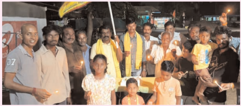
ప్రజా భూమి ప్రతినిధి-కామవరపుకోట