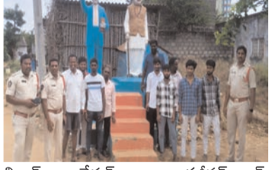
బి.ఆర్. అంబేద్కర్, బాబు జగజ్జీవన్ రామ్ విగ్రహాలను పరిశీలించారు.