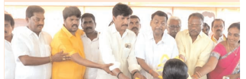
ప్రజా భూమి ప్రతినిధి-పాలకొల్లు

ఘనంగా చంద్రబాబు నాయుడు జన్మదినోత్సవ వేడుకలు.