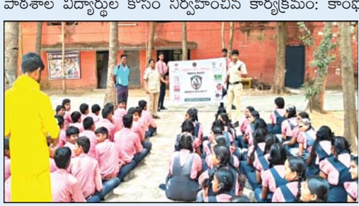
సృంచివే విధానంపై మార్గదర్శకాలు ఇచ్చారు. ఈ సందర్భంగా శక్తి యాక్స్ డౌన్లోడ్ చేసుకోవడం, వినియోగ విధానం, ఎస్ ఓ ఎస్ ఫీచర్ ద్వారా తక్షణ సహాయం పొందే విధానం గురించి ప్రాక్టికల్ గా వివరించారు. మహిళలు తమ పరిసర ప్రాంతాల్లో కూడా ఈ అవగాహనను విస్తరించి, ఇతర మహిళల మరియు బాలికలకు తెలియజేయాలని సూచించారు. మహిళలు మరియు పిల్లల భద్రతకు చిత్తూరు జిల్లా పోలీసు శాఖ ఎల్లప్పుడూ కట్టుబడి ఉందని, ప్రజలు పోలీసుల సహకారంతో అప్రమత్తంగా ఉంటే నేరాలను తగ్గించవచ్చని అధికారులు తెలిపారు.