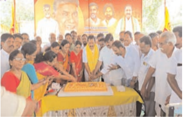
క్యాంపస్ కు విరాళంగా ఇవ్వడం జరిగిందన్నారు. పేద ప్రజల పట్ల ఆ కుటుంబానికి ఉన్న ప్రేమ, శ్రద్ధ దీనిబట్టి అర్థమవుతుందన్నారు. తెలుగుదేశం పార్టీ పుట్టుక అధికారం కోసం, ఆదంబరాల కోసం, పెత్తనం కోసం జరగలేదన్నారు. పేద ప్రజలకు పట్టడం పెట్టడం కోసం పుట్టిన పార్టీ తెలుగుదేశం అన్నారు. పేద ప్రజల సేవలో తరిస్తున్న పార్టీ తెలుగుదేశం అన్నారు. సమాజమే దేవాలయం, పేద ప్రజలే దేవుళ్లు అని నిరందించిన మహానీయుడు విశ్వవిఖ్యాత సలసార్కాభౌమ నందమూరి తారక రామారావు పెట్టిన పార్టీ తెలుగుదేశం పార్టీ అని, 44 సంవత్సరాలుగా అవిత్రాంతంగా, అధికారంలో ఉన్నా, లేకపోయినా పెద్ద ఎత్తున పేద ప్రజల కోసమే పనిచేస్తూ ఉండన్నారు. అభివృద్ధి కోసం, సంక్షేమం కోసం ఆలోచించే పార్టీ తెలుగుదేశం పార్టీ అన్నారు. చంద్రబాబు నాయుడు పుట్టినరోజు నాడు సైతం సేవా కార్యక్రమాల్లో పరమాపధిగా ముందుకెళ్లడం జరుగుతుందన్నారు. రాష్ట్ర విభజన తరువాత నన్యాంధ్రప్రదేశ్ ముఖ్యమంత్రిగా చంద్రబాబు నాయుడు రాష్ట్ర అభివృద్ధి కోసం పునాది వేశారని, అయితే 2019లో కూడా అది

కొత్తూరు సెంటర్లో చలివేంద్రాన్ని ప్రారంభించారు. కొత్తూరు సెంటర్ ఎస్ జె ఆర్ ఫంక్షన్ హాల్లో కేక కట్ చేసి వేడుకలు జరిపారు. అనంతరం ఆయన ఆకుల రామకృష్ణ రక్తదాన శిబిరాన్ని ప్రారంభించారు. తెలుగు దేశం పార్టీకి అంకిత భావంతో పనిచేస్తున్న కార్యకర్తలను సత్కరించారు. ఈ సందర్భంగా ఆయన మాట్లాడుతూ రాజకీయ దురంధుడు, అంచలంచెలా దేశవ్యాప్తంగా, ప్రపంచ వ్యాప్తంగా తెలుగుజాతి కిచ్చిన దశదశలా వ్యాపింపజేసిన గొప్ప నాయకుడు నారా చంద్రబాబు నాయుడని, ఆయన నిండు సూరేష్లు అయిదారోళ్ళులతో వర్షిల్లాలని ఆకాంక్ష వ్యక్తం చేస్తూ ఎమ్మెల్యే ముఖ్యమంత్రి చంద్రబాబుకు శుభాకాంక్షలు తెలియజేశారు. చంద్రబాబు నాయుడు సారథ్యంలో నాలుగవసారి తాను ఎమ్మెల్యేగా పనిచేస్తూ ఉండడం తన అదృష్టం గా భావిస్తున్నానన్నారు. చంద్రబాబు నాయుడు గురించి ఎంత మాట్లాడినా తక్కువే అవుతుందన్నారు. అవిత్రాంత పోరాట యోధుడిగా, నిరంతర శ్రామికుడిగా, నిత్య విద్యాల్లిగా ప్రపంచంలో అన్ని అంశాలపై పట్టు సాధించి, భవిష్యత్తును ముందుగానే ఊహించి రాజీయ తరాలకు మార్గాన్ని ఏర్పాటు చేసే మహాశక్తుల నాయకుడు చంద్రబాబు నాయుడు అని ఆయన కొనియాడారు. ముందు చూపుతో రాష్ట్ర భవిష్యత్తుకు పునాదులు వేస్తున్న నాయకుడు చంద్రబాబు నాయుడని ప్రశంసించారు. చంద్రబాబు నాయుడు పుట్టినరోజు సందర్భంగా ఆయన సతీమణి నారా భువనేశ్వరమ్మ అనుమతితో రూ.76 లక్షలు రాష్ట్రవ్యాప్తంగా ఉన్న అన్ని