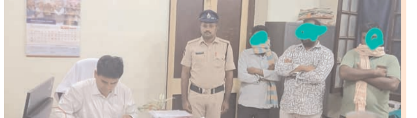
ప్రజా భూమి ప్రతినిధి-సూజీవిడు

- పాత నేరస్థులకు బైండి ఓవర్, బెల్ట్ షాపులపై హెచ్చరిక