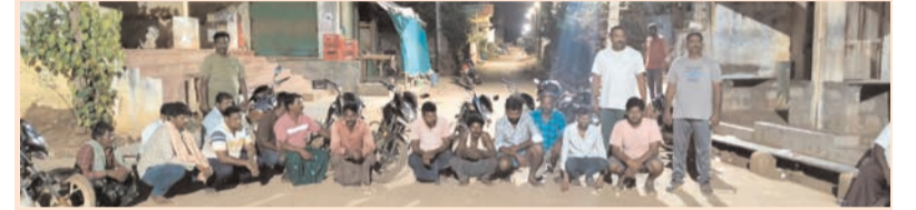
ప్రజా భూమి ప్రతినిధి-ఆగరిపల్లి