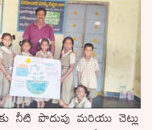
ప్రజా భూమి ప్రతినిధి తొట్టంటేడు మండలం లోని దిగువ సాంబయ్య పాఠశాల మండేషన్ స్కూల్ లో విద్యార్థులకు నిర్వహిస్తున్న జల పాఠశాల కార్యక్రమం లో భాగంగా విద్యార్థులు ,ఉపాధ్యాయులు కయ్యూరు బాలసంఘ మణ్ణం సహకారం తో నీటి సంరక్షణ పోస్టర్ ని తయారు చేసి ప్రదర్శించారు. ఈ సందర్భంగా బాల మాట్లాడుతూ పాఠశాల స్థాయిలోనే విద్యార్థులకు నీటి పొదుపు మరియు చెల్లు నాటడం పై అవగాహన కల్పించాలి, వర్షపునీరు భాగం జలాలుగా మారడంలో ఇంకం గుంతులు ప్రాముఖ్యతను వివరించాలని, పుధా నీటిని అరికట్టాలని సూచించారు. అనంతరం విద్యార్థులు తాము తయారు చేసిన జల సంరక్షణ పోస్టర్ తో గ్రామంలో నీటిని సంరక్షించండి, చెట్లను కాపాడండి అంటూ నినాదాలతో ర్యాలీ నిర్వహించారు.