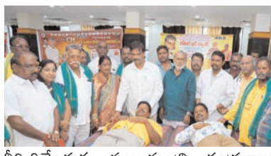
తీర్చిదిద్దేందుకు ముఖ్యమంత్రి చంద్రబాబు నాయుడు కృషి చేస్తున్నారని పేర్కొన్నారు. అమరావతి నిర్మాణాన్ని వేగవంతంగా పూర్తి చేస్తూ అభివృద్ధి దిశగా ముందుకు తీసుకెళ్తున్నారని తెలిపారు. రాష్ట్ర ముఖ్యమంత్రి నారా చంద్రబాబునాయుడు 76వ జన్మదిన శుభాకాంక్షలు అందించడం రాష్ట్ర ప్రజల అదృష్టంగా భావించాలన్నారు. గత వైయస్

రం మొత్తంగా వెయ్యికి పైగా లబ్ధిదారులు ప్రయోజనం పొందారు. దృష్టి లోపం ఉన్న వారికి 29 మందికి అపరోషన్లు నిర్వహిస్తామన్నారు. అలాగే 50 మందికి కళ్లజిడ్లు ఉచితంగా పంపిణీ చేశారు. ఈ కార్యక్రమానికి ముఖ్య అతిథిగా హాజరైన రాష్ట్ర కార్యకర్తల తదితర సేవలు అందించారు. ట్రస్ట్ హాస్పిటల్ ద్వారా 264 మందికి, కిరీత్ కంటి ఆసుపత్రి ద్వారా 270 మందికి, భవాని డెంబిల్ హాస్పిటల్ ద్వారా 115 మందికి, మెడికవర్ ఆసుపత్రి ద్వారా 85 మందికి వైద్య సేవలు అందించారు.