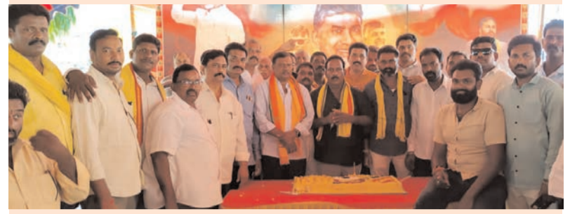
ప్రజా భూమి ప్రతినిధి-సూజీవిడు

సూజీవిడు పట్టణంలోని అన్నా క్యాంపస్ వద్ద ముఖ్యమంత్రి నారా చంద్రబాబు నాయుడు 76వ జన్మదిన వేడుకలను కూటమి నాయకులు, కార్యకర్తలు ఘనంగా నిర్వహించారు. కేక కట్ చేసి ఒకరికొకరి ఒకరు స్వీట్లు పంచుకొని శుభాకాంక్షలు తెలిపారు. అనంతరం అన్నా క్యాంపస్ లో పేదలకు అన్న ప్రసాదం వడ్డించారు. ఈ సందర్భంగా నాయకులు మాట్లాడుతూ రాష్ట్ర అభివృద్ధికి ఆయన చేసిన సేవలను గుర్తుచేశారు. కార్యక్రమంలో కూటమి నాయకులు పాల్గొన్నారు.