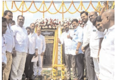
వెల్లడించారు. ట్రాన్స్ కో రూపొందించిన డివీఆర్ అద్భుతంగా ఉందని, డీసీకి మంత్రి గొట్టిపాటి రవికుమార్ పూర్తి సహకారం అందించారని, సమస్యల పరిష్కారంలో ఆయన సమర్థ నాయకత్వాన్ని ప్రశంసించారు. పుష్కరాలను 2027 జూన్, జూలై నెలల్లో వైభవంగా నిర్వహించేందుకు ప్రభుత్వం కట్టుదిట్టమైన ఏర్పాట్లు చేస్తోందని మంత్రి దుర్గేశ్ తెలిపారు. రాజమహేంద్రవరం ప్రజల చిరకాల కోరిక అయిన హేపలాక్ ట్రిప్లీను ఆధునికీకరించి పాదచారులకు అనుకూలంగా సుందరీకరించనున్నట్లు చెప్పారు. కేంద్రం మంజూరు చేసిన రూ.94 కోట్ల నిధులతో అఖండ గోదావరి ప్రాజెక్టు పనులు వేగవంతం చేసినట్లు వెల్లడించారు. ఉత్తరాది కుంభమేళా తరచులో భక్తులకు వసతి కల్పించేందుకు

సరఫరా అందిస్తున్నామని తెలిపారు. ఒక్కరోజులోనే రూ.485 కోట్ల వ్యయంతో 8 పనులకు సంబంధించిన శంకుస్థాపనలు, ప్రారంభోత్సవాలు నిర్వహించడం ప్రభుత్వ పనితీరుకు నిదర్శనమన్నారు. గత ప్రభుత్వం తొమ్మిది సార్లు విద్యుత్ ఛార్జీలు పెంచడం, అయితే కూటమి ప్రభుత్వం వచ్చిన తర్వాత ఇప్పటివరకు ఒక్క రూపాయి కూడా పెంచలేదని గుర్తుచేశారు. అదేవిధంగా పీఎం సూర్య ఘోష యోజన ద్వారా ఎస్సీ, ఎస్టీ వర్గాలకు ఉచితంగా, ఇతరులకు భారీ సబ్సిడీతో సోలార్ ప్యానెల్స్ ఏర్పాటు చేస్తున్నట్లు పేర్కొన్నారు. టీసీలకు కేంద్రం ఇచ్చే రూ.78 వేల సబ్సిడీకి తోడు రాష్ట్ర ప్రభుత్వం మరో రూ.20 వేల సబ్సిడీ అందిస్తున్నట్లు వివరించారు. మంత్రి కందుల దుర్గేశ్ మాట్లాడుతూ, వినియోగదారులపై ఆదనపు భారం లేకుండా నాణ్యమైన, నిరంతరాయ విద్యుత్ అందించడమే ప్రభుత్వ లక్ష్యమని తెలిపారు. గతంలో విద్యుత్ సరఫరాలో అంతరాయాలు ఉండేవి, అయితే ప్రస్తుతం ఎక్కడా కోతలు లేవని పేర్కొన్నారు. దాదాపు రూ.100 కోట్ల వ్యయంతో 56 రకాల విద్యుత్ పనులు చేపట్టినట్లు