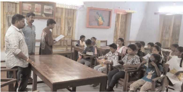
ప్రజా భూమి ప్రతినిధి-పెదపాడు