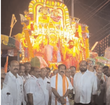
అన్నవరం పరిసర ప్రాంతాల నుండి కాకుండా, వివిధ ప్రాంతాల నుండి వేలాది మంది