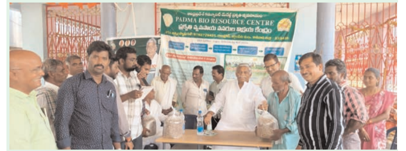
ప్రజా భూమి ప్రతినిధి-జగ్గంపేట