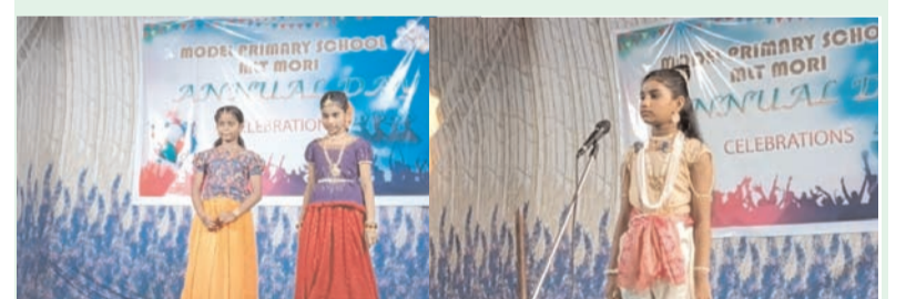
ప్రజా భూమి ప్రతినిధి-సఖినేటిపల్లి