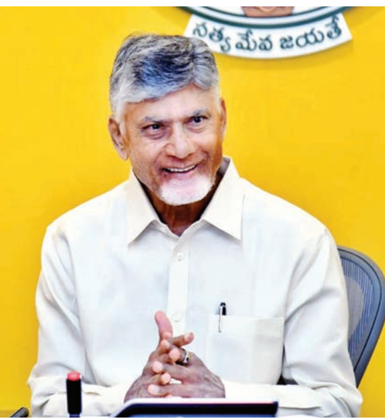
గతేడాది నవంబర్లో విశాఖపట్నంలో జరిగిన సీబిఐ పార్లమెంట్ సమీక్షకు హాజరైన రెన్యూ ఎనర్జీ గ్రిడ్లలో సంస్థ రాష్ట్రంలో దశలవారీగా రూ.82,000 కోట్ల పెట్టుబడులు పెడతామని ప్రకటించింది. దీంతో భాగంగా అనకాపల్లి జిల్లా రాంబిల్లిలో ఎనర్జీ ప్లాంట్ ఏర్పాటుకు పనులను ప్రారంభించనుండగా... త్వరలోనే సుమారుగా రూ.22,000 కోట్లతో దేశంలోనే అతిపెద్ద

అనకాపల్లి జిల్లా రాంబిల్లిలో రెన్యూ ఎనర్జీ గ్రిడ్లలో సంస్థ 6 గిగా వాట్లకు పైగా ఉత్పత్తి సామర్థ్యంతో క్లీన్ ఎనర్జీ ప్లాంట్ ఏర్పాటుకు ముందుకు వచ్చింది. దీంతో భాగంగా ఆ ప్లాంట్ కు భూమి పూజ గురువారం జరగనుంది. ముఖ్యమంత్రి నారా చంద్రబాబు నాయుడు భూమి పూజ చేయనున్నారు. మొత్తంగా రూ.5,400 కోట్ల పెట్టుబడులతో ఏర్పాటు చేయబోయే సంస్థకు భూమి పూజ చేపట్టడంతో అనకాపల్లి జిల్లా అభివృద్ధికి కీలక అడుగులు పడుతున్నాయి. డీకార్బనైజేషన్ రంగంలో ముందంజలో ఉన్న ఈ సంస్థ.. సుమారు రూ.4,200 కోట్ల పెట్టుబడితో 6 గిగావాట్ల సామర్థ్యం గల సోలార్ ఇంజనీ-వేఫర్ తయారీ యూనిట్ ను ఏర్పాటు చేయబోతోంది. దీంతో పాటు మరో 1,200 కోట్ల వ్యయంతో 125 మోగావాట్ల హైట్రీడ్ క్యాప్టివ్ రెన్యూబుల్ పవర్ ప్రాజెక్టును నిర్మించనుంది. ఈ రెండు ప్రాజెక్టులు వచ్చే రెండేళ్లలో పూర్తి కానున్నాయి.