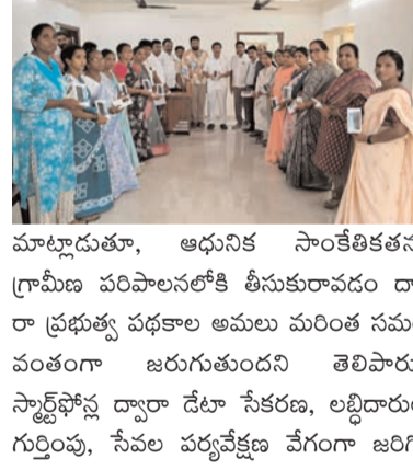
మాట్లాడుతూ, ఆధునిక సాంకేతికతను గ్రామీణ పరిపాలనలోకి తీసుకురావడం ద్వారా ప్రభుత్వ పథకాల అమలు మరింత సమర్థవంతంగా జరుగుతుందని తెలిపారు. స్టార్ట్ ఫోస్ల ద్వారా డేటా సేకరణ, లబ్ధిదారుల గుర్తింపు, సేవల పర్యవేక్షణ వేగంగా జరిగి,

ప్రజాభూమి ప్రతినిధి-కొత్తపేట గ్రామీణ స్థాయిలో ప్రభుత్వ పథకాల అమలును మరింత వేగవంతంగా, పారదర్శకంగా చేయడానికి స్టార్ట్ ఫోస్ల కీలక పాత్ర పోషిస్తున్నాయని ఎమ్మెల్యే బండారు సత్యానందరావు పేర్కొన్నారు. కొత్తపేటలోని సీపీవీపీ (కానిస్ట్యుటయన్) విజనరీ యాక్సన్ ప్లాన్ కార్యాలయంలో మంగళవారం నిర్వహించిన కార్యక్రమంలో ఆత్రేయపురం మండలానికి చెందిన వెలుగు వీడియోలు విధులు నిర్వహిస్తున్న 34 మందికి స్టార్ట్ ఫోస్లను ఎమ్మెల్యే పంపిణీ చేశారు. ఈ సందర్భంగా ఆయన