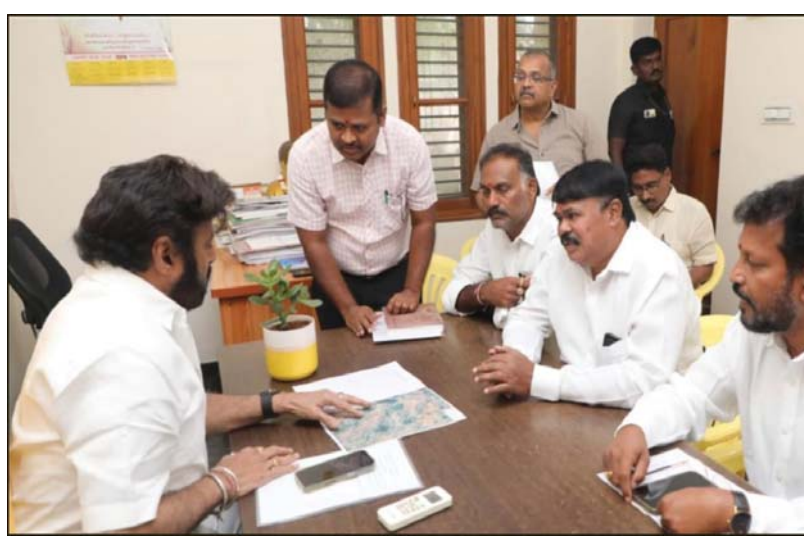
నందమూరి బాలకృష్ణను నన్నానించి కృతజ్ఞతలు తెలిపారు. ఈ కార్యక్రమంలో తెలుగుదేశం పార్టీ నాయకులు పాల్గొన్నారు.