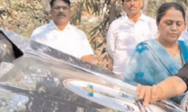
అధ్యక్షులతో కార్యక్రమాలు నిర్వహించనున్నట్లు తెలిపారు. ప్రజలకు న్యాయం మరింత చేరువ చేయడమే ఈ కార్యక్రమం ముఖ్య ఉద్దేశం అన్నారు. ప్రజల్లో చైతన్యం కలిగించే సాధనంగా ఈ వాహనం ఉంటుంది అన్నారు. ఈ కార్యక్రమంలో కడప హెచ్ క్యాబ్ లో

మొబైల్ న్యాయసేవల వాహనాన్ని ప్రారంభిస్తున్న చైర్మన్, జిల్లా ప్రధాన న్యాయమూర్తి జిల్లా న్యాయ సేవాధికార సంస్థ కడప మాట్లాడుతూ గ్రామీణ, మారుమూల ప్రాంత ప్రజలకు న్యాయ సహాయం అందించేందుకు ఈ వాహనం ఉపయోగపడనుంది. అణగారిన వర్షాల గడప వరకు న్యాయ సేవలు తీసుకెళ్లాలన్నారు. ఉచిత న్యాయసహాయం, న్యాయ అవగాహన కార్యక్రమాలు, ప్రభుత్వ సంక్షేమ పథకాలపై అవగాహన, చట్టపరమైన మార్గదర్శనం వంటి సేవలు ఇందులో అందించనున్నారు. జిల్లా న్యాయ సేవాధికార సంస్థ