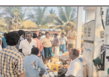
యంత్రాలకు సైతం డిజిల్ కొరత కారణంగా పలుచోట్ల వరి కోతలకు అంతరాయం ఏర్పడుతుంది. బంకుల్లో గంటలు తరబడి నీలిగింది అంతరాయం ఇస్తూ మహా అనిపించడంతో రైతుల ఆందోళన గురవుతున్నారు.

మండలానికి చెందిన పలువురు పేర్కొన్నారు. కాజులూరు మండలంలో పెట్రోల్ బంకుల్లో డిజిల్, పెట్రోల్ కృత్రిమ కొరత సృష్టించి బంకు యజమానులు అదనపు ధరలకు విక్రయిస్తున్నారని కొనుగోలుదారులు గగ్గోలు పెడుతూ ఆరోపిస్తున్నారు. దీనిపై అధికారులు స్పందన కరువైంది ఆక్సీ రైతులకు సమయానికి కరెంటు రాక జనరేటర్లు డిజిల్ లోకే ఆక్సీ రైతుల అల్లలాడిపోతున్నాయి. లక్షలాది రూపాయలు ఖర్చులు పెట్టి ఆక్సీ సాగు చేస్తున్న రైతులు కథలు కన్నీటి పర్యంతం అవుతున్నాయి. దీనికి తోడు మండలంలో పలుచోట్ల గురువారం రాత్రి సుమారు ఐదు గంటలపాటు కరెంటు కోత ఏర్పడడంతో ఆక్సీ రైతులకు గానికి పుండు మీద కారం చల్లినట్లుగా అనిపించింది పరి కోతలు ముమ్మరంగా జరుగుతున్న సమయంలో వరి కోత