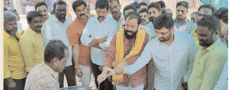
ప్రజా భూమి ప్రతినిధి-ఏలూరు