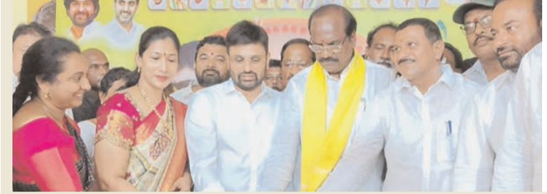
ప్రజా భూమి ప్రతినిధి-ఏలూరు