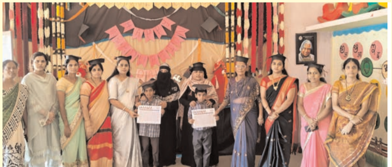
ప్రజాభూమి ప్రతినిధి-హిందూపురం టౌన్