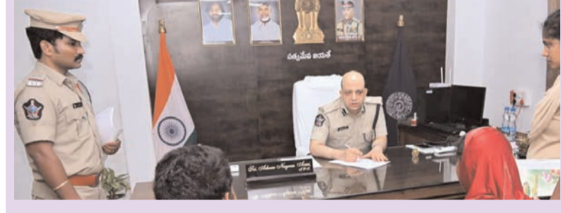
ప్రజాభూమి ప్రతినిధి - భీమవరం జిల్లా పోలీసు ప్రధాన కార్యాలయంలో సోమవారం నిర్వహించిన "ప్రజా సమస్యల పరిష్కార వేదిక" (పీజీఆర్ఎస్) కార్యక్రమం ద్వారా ప్రజల నుండి జిల్లా ఎస్సీ అధికారులతో ముఖాముఖీ మాట్లాడి, వారి సమస్యల పూర్ణమలం అడిగి తెలుసుకున్నారు. అనంతరం సంబంధిత పోలీసు అధికారులతో ఫోన్ ద్వారా మాట్లాడి, క్షేత్రస్థాయిలో పూర్తి విచారణ జరిపి, నిర్ణీత గడువులోగా చట్టపరమైన శాస్త్ర పరిష్కారం చూపాలని ఆదేశించారు. ఈ సందర్భంగా జిల్లా ఎస్సీ మాట్లాడుతూ ప్రజలు తమ సమస్యల పరిష్కారం కోసం ఎంతో ఆశతో పోలీసు కార్యాలయాలను ఆశ్రయిస్తారని, అటువంటి బాధితులకు పోలీసు శాఖ వెమ్ములుగా నిలిచి భరోసా కల్పించాలని అధికారులకు స్పష్టం చేశారు. ముఖ్యంగా ఫిర్యాదులు మరల మరల పునరావృతం కాకుండా ఉండాలంటే, మొదటి విధి తప్పేనే తొలగి దయపూరిత జరిపి బాధితులకు న్యాయం చేకూరేలా చూడాలన్నారు. విచారణలో జాప్యం వహించకుండా, పారదర్శకమైన పద్ధతిలో సమస్యలను పరిష్కరించడమే లక్ష్యంగా వనిచేయాలని ఆయన ఉద్ఘాటించారు. ఈ కార్యక్రమంలో మహిళా పోలీసు స్టేషన్ డిఎస్సీ యు. రవీంద్ర, జిల్లా స్పెషల్ ట్రాన్స్ ఇన్స్పెక్టర్ కె.వి.వి.ఎన్ సత్యనారాయణ ఇతర పోలీసు అధికారులు, సిబ్బంది పాల్గొన్నారు.