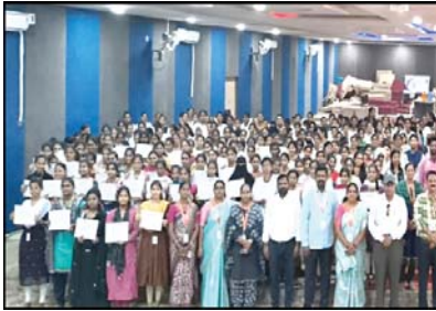
తమైన అప్రెంటిస్ ప్రాక్టీస్ వంటి ముఖ్యమైన అంశాలను నేర్చుకున్నారు. ఈ విషయాలపై శిక్షణ ద్వారా విద్యార్థులు ఇన్ఫోసీస్, బీసీసీ, అమెజాన్, టాటా కన్సల్టెన్సీ సర్వీసెస్ వంటి ప్రముఖ కంపెనీల ఉద్యోగ అవకాశాలకు సిద్ధం చేయబడారు. శిక్షణలో పాల్గొన్న ముఖ్య వ్యక్తులు: ఈ శిక్షణ కార్యక్రమం విజయవంతంగా నిర్వహించడానికి ఆడినంతరం డీఎం టూ బి యూనివర్సిటీ మరియు నాండి ఫౌండేషన్ భాగస్వామ్యంగా పనిచేశారు.

అభివృద్ధి పై ప్రత్యేక దృష్టి పెట్టడం జరిగింది. శిక్షణ పట్ల విద్యార్థుల స్పందన: ఈ శిక్షణ ద్వారా, అన్ని విభాగాల నుండి మహిళా విద్యార్థులు మంచి స్పందన ఇచ్చారు. సంఘ సంభాషణ మరియు అప్రెంటిస్ ప్రాక్టీసులకు సంబంధించిన పనులపై వారికి విశేష అభిప్రాయాలు తెలియజేశారు. ఈ శిక్షణ వారికి వారి కెరీర్లో ముందుకు పోవడంలో కీలకమైన దారి చూపిస్తుంది. కార్యక్రమం ఉద్దేశ్యం: ఈ శిక్షణ కార్యక్రమం మహిళా విద్యార్థులకు నైపుణ్యాల, అభివృద్ధిని పెంపొందించడం, ప్రపంచవ్యాప్త ఉద్యోగ అవకాశాలను అందించడానికి, ఇతర యువత కోసం దారితీసే ఉత్సాహ రూపొందించబడింది. ఈ శిక్షణపై సారాంశం: ఈ శిక్షణ కార్యక్రమం ఉద్యోగ నైపుణ్యాలను పెంచడానికి మరియు విద్యార్థుల భవిష్యత్తుకు సమృద్ధిని అందించడంలో కీలక అడుగులు వేయడంలో సహాయపడింది.