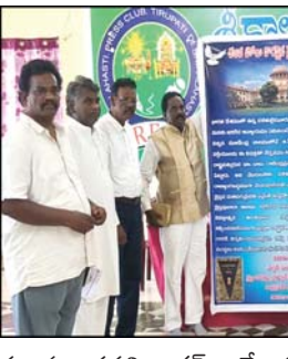
కేటాయించుచున్నాము. ఇలాంటి వివక్షతో నిండిన ప్రయోగాలు ఒక దళిత కులస్థుల మీద మాత్రమే ఆ నాడు ప్రయోగించడం జరిగింది.

కేటాయించుచున్నాము. ఇలాంటి వివక్షతో నిండిన ప్రయోగాలు ఒక దళిత కులస్థుల మీద మాత్రమే ఆ నాడు ప్రయోగించడం జరిగింది. నేటికీ దళితులైన క్రైస్తవులు కుల పరమైనవి మరియు మతపారమైనవి కోల్పోవడం జరిగింది. అందుకని నేటికీ స్వాతంత్ర్యం రాని వారు ఎవరైనా ఉన్నారా అంటే వారు దళితులేనని గ్రహించండి. మరలా అదే స్వాతంత్ర్యం మనం కలిగి ఉండాలి అంటే ఏ రాష్ట్రపతి ద్వారా అయితే దళితులకు ఈ అన్యాయం జరిగిందో అదే స్థానములో ఉన్న రాష్ట్రపతి ద్రౌపతి మూర్తు చొరవ తీసుకొని న్యాయం చేస్తే దళితులమైన మనము ధన్యులమే అవుతాము దీని కొరకు మా విన్నపము ఏమిటి అంటే మూడు విషయాలను మనం తెలియపరచవలసియుంది అవి ఏవి అనగా తెలుగు రాష్ట్రాలు మాత్రమే కాక భారతదేశంలో ఉన్న క్రైస్తవులు అందరూ అటు అసెంబ్లీకి వెళ్లి ఎమ్మెల్యేలు లకు పార్లమెంట్ వెళ్లి ఎంపీ లకును ప్రతి రాష్ట్రములో ఉన్న ముఖ్యమంత్రులకును మన గోడు వినిపించుట కొరకు మీరు అందరూ ఏకము కావాలని కోరుతు 27-04-2026 సాయంత్రం మూడు గంటలకు శ్రీకాళహస్తి పట్టణంలో అంబేద్కర్ విగ్రహం వద్ద నిరసన తెలియ చేస్తూ ఈ విరాళ వేదికను కొనసాగించడానికి దళితులు దళిత క్రైస్తవులు అందరూ సహకరించగలరు అని మీకు విన్న వింతుచున్నాము. ఈ కార్యక్రమంలో క్రైస్తవ సంఘాల పాస్టర్ తదితరులు పాల్గొన్నారు.