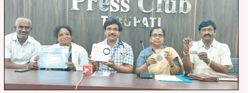
Press Club TUPATI