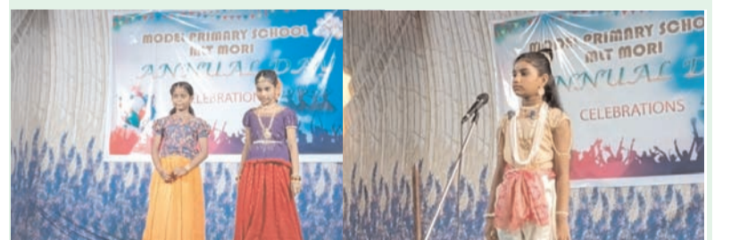
ప్రజా భూమి ప్రతినాటి-సఖినేటిపల్లి