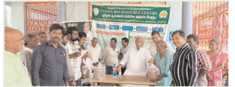
ప్రజా భూమి ప్రతినాటి-జగ్గంపేట