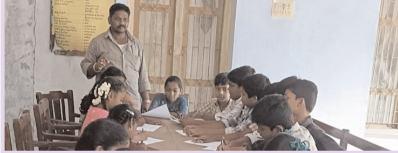
ప్రజా భూమి ప్రతినిధి-పెదపాడు