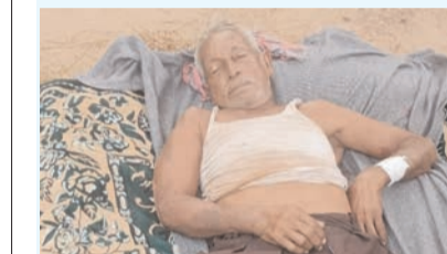
ప్రజా భూమి ప్రతినిధి-కొత్తపేట.