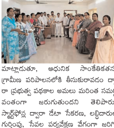
మాట్లాడుతూ, ఆధునిక సాంకేతికతను గ్రామీణ పరిపాలనలోకి తీసుకురావడం ద్వారా ప్రభుత్వ పథకాల అమలు మరింత సమర్థవంతంగా జరుగుతుందని తెలిపారు.

ప్రజాభూమి ప్రతినిధి-కొత్తపేట గ్రామీణ స్థాయిలో ప్రభుత్వ పథకాల అమలును మరింత వేగవంతంగా, పారదర్శకంగా చేయడానికి స్టార్ట్ ఫోస్లు కీలక పాత్ర పోషిస్తాయని కొత్తపేట ఎమ్మెల్యే బండారు సత్యానందరావు పేర్కొన్నారు. కొత్తపేటలోని సీపీవీపీ (కానిస్ట్యుటయర్స్) విజనరీ యాక్సన్ ప్లాన్ కార్యాలయంలో మంగళవారం నిర్వహించిన కార్యక్రమంలో ఆత్రేయపురం మండలానికి చెందిన వెలుగు వీడియోలు విధులు నిర్వహిస్తున్న 34 మందికి స్టార్ట్ ఫోస్లను ఎమ్మెల్యే పంపిణీ చేశారు. ఈ సందర్భంగా ఆయన