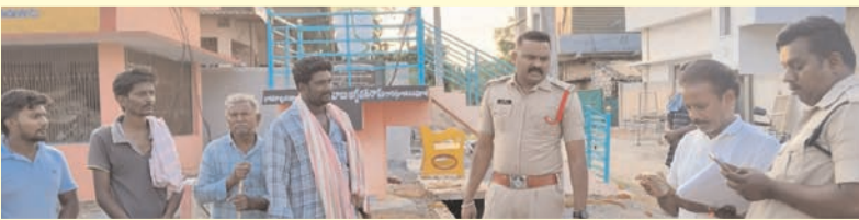
ప్రజా భూమి ప్రతినిధి-ఆగిరిపల్లి