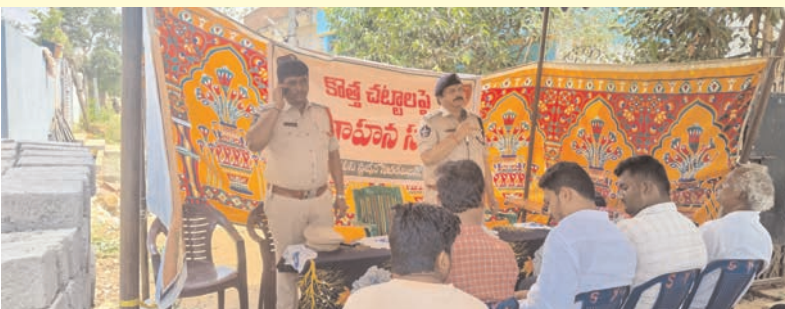
ప్రజా భూమి ప్రతినిధి-ఆగిరిపల్లి