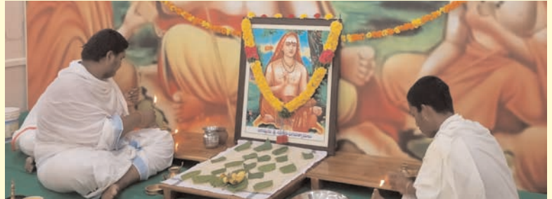
ప్రజా భూమి ప్రతినిధి-ఆగిరిపల్లి

జగద్గురు ఆది శంకరాచార్యుల జయంతి సందర్భంగా చతుర్వేద పారాయణం