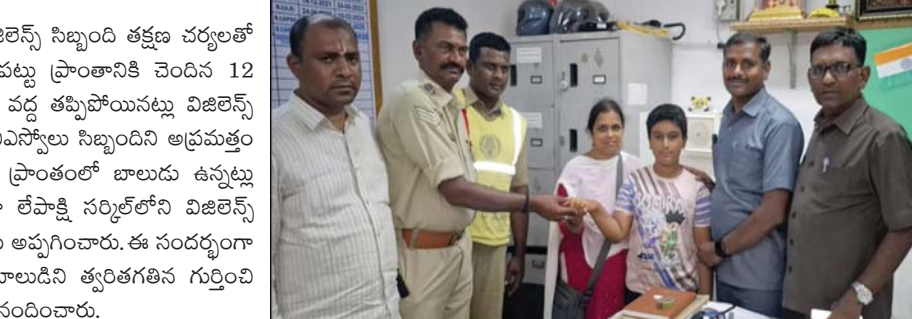
అలిపిరి మెట్ల మార్గంలో తప్పిపోయిన ఒక బాలుడిని తిరుపతి తిరుపతి దేవస్థానం విజిలెన్స్ సిబ్బంది తక్షణ చర్యలతో గుర్తించి సురక్షితంగా కుటుంబ సభ్యులకు అప్పగించారు.

ప్రజా భూమి తిరుపతి అలిపిరి 18: అలిపిరి మెట్ల మార్గంలో తప్పిపోయిన ఒక బాలుడిని తిరుపతి తిరుపతి దేవస్థానం విజిలెన్స్ సిబ్బంది తక్షణ చర్యలతో గుర్తించి సురక్షితంగా కుటుంబ సభ్యులకు అప్పగించారు. తమిళనాడు రాష్ట్రం చంగల్ లోపు ప్రాంతానికి చెందిన 12 సంవత్సరాల ఆడర్డ్ అనే బాలుడు అలిపిరి మెట్ల మార్గంలో సుమారు 2500వ మెట్ల వద్ద తప్పిపోయినట్లు విజిలెన్స్ కమాండ్ కంట్రోల్ రూమ్ కు సమాచారం అందింది. సమాచారం అందుకున్న వెంటనే ఏపీఎస్ఎస్ సిబ్బందిని అప్రమత్తం చేసి విస్తృతంగా గాలింపు చర్యలు చేపట్టారు. ఈ క్రమంలో తిరుపతిలోని గ్రూప్-2 ప్రాంతంలో బాలుడు ఉన్నట్లు విజిలెన్స్ మరియు సెక్యూరిటీ సిబ్బంది గుర్తించారు. తరువాత బాలుడిని సురక్షితంగా లేపాక్షి నర్సిలోని విజిలెన్స్ కార్యాలయానికి తీసుకువచ్చి, సంబంధిత అధికారుల సమక్షంలో అతని కుటుంబ సభ్యులకు అప్పగించారు. ఈ సందర్భంగా బాలుడి కుటుంబ సభ్యులు విజిలెన్స్ సిబ్బందికి కృతజ్ఞతలు తెలిపారు. తప్పిపోయిన బాలుడిని త్వరితగతిన గుర్తించి సురక్షితంగా కుటుంబానికి చేరవేసిన విజిలెన్స్ సిబ్బందిని టీటీడీ ఉన్నతాధికారులు అభినందించారు.