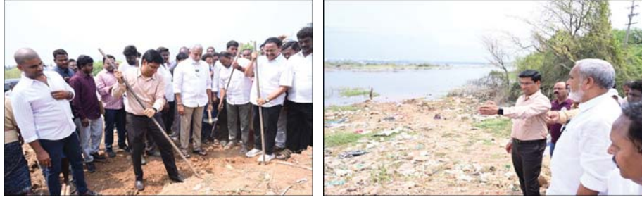
చేపడుతుందన్నారు.. 100 రోజులు నిర్వహించే ఈ కార్యక్రమంలో చెరువులను, నీటి కుంటలను కాపాడుకుంటూ నీటి వనరులను పెంచుకోవడమే ఈ కార్యక్రమం యొక్క ముఖ్య ఉద్దేశం అని తెలిపారు. చెరువు కట్ట సంరక్షణకు జల వనరుల శాఖ అధికారులకు కొన్ని సూచనలు నలహాలు కలెక్టర్, ఎమ్మెల్యే ఇవ్వడం జరిగింది. స్వయంగా ఎమ్మెల్యే ద్వితీయ వాహనంలో కలెక్టర్ ని ఎక్కించుకొని చెరువుగట్ట పరిసర ప్రాంతాలను పరిశీలించడం జరిగింది. ఈ కార్యక్రమంలో తిరుపతి ఆర్డీవో రామ్మోహన్, జల వనరుల శాఖ ఈ ఈ వెంకటేశ్వర్ ప్రసాద్, సాగునీటి సంఘ సభ్యులు, తదితరులు పాల్గొన్నారు.

ప్రజా భూమి ప్రతినిధి చంద్రగిరి. భూగర్భ జలాలను పెంపొందించడం మరియు నీటి భద్రతను బలోపేతం చేయడం కోసం ప్రభుత్వం ప్రతిష్టాత్మకంగా చేపట్టిన కార్యక్రమం "జలధార-జలహారతి". 100 రోజుల యాక్షన్ ప్లాన్ లో పనులు చేపట్టడం జరుగుతుందని జిల్లా కలెక్టర్ డా ఎస్ వెంకటేశ్వర్ తెలిపారు. శనివారం స్థానిక చంద్రగిరి నియోజకవర్గం పేరూరు చెరువు వద్ద స్వచ్ఛ ఆంధ్ర స్వచ్ఛ ఆంధ్ర కార్యక్రమంలో భాగంగా జలధార జలహారతి లో ఎం ఎల్ ఎ పులివర్తి నాని తో కలిసి పాల్గొన్న జిల్లా కలెక్టర్.. జిల్లా కలెక్టర్ మాట్లాడుతూ.. భూగర్భ జలాలను పెంపొందించడం మరియు నీటి భద్రతను బలోపేతం చేయడం కోసం ప్రభుత్వం ప్రతిష్టాత్మకంగా చేపట్టిన కార్యక్రమం "జలధార-జలహారతి". 100 రోజుల యాక్షన్ ప్లాన్ లో పనులు చేపట్టడం జరుగుతుందని తెలిపారు. ఉపాధి హామీ పథకంతో అనుసంధానం చేసి జిల్లా వ్యాప్తంగా చెరువుల పునరుద్ధరణ, చెక్ డ్యామ్స్ నిర్మాణంపై ఈ కార్యక్రమం దృష్టి పెడుతుందని అన్నారు. ప్రభుత్వం జల వనరుల శాఖ ఆధ్వర్యంలో ప్రతిష్టాత్మకంగా చేపడుతున్న ఈ కార్యక్రమం ద్వారా నీటి నిల్వలు పెరిగి... వ్యవసాయానికి, త్రాగునీరుకు ఇబ్బంది లేకుండా ఉంటుందన్నారు.. ఎమ్మెల్యే మాట్లాడుతూ.. రానున్నది ఎండకాలం... వేసవి తాపానికి ప్రజలు, రైతులు ఇబ్బంది పడకూడదన్న ముందస్తు జాగ్రత్తలు భాగంగా ఈ కార్యక్రమాన్ని ప్రభుత్వం