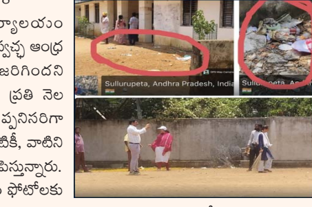
నూళ్లూరుపేట తహసీల్దార్ కార్యాలయం ఆవరణలో నిర్వహించిన స్వచ్ఛంద - స్వచ్ఛ ఆంధ్ర కార్యక్రమం తూతూ మండలం జరిగిందని స్థానికులు విమర్శిస్తున్నారు. ప్రభుత్వం ప్రతి నెల 4వ శనివారం ఈ కార్యక్రమాన్ని తప్పనిసరిగా నిర్వహించాలని ఆదేశాలు జారీ చేసినప్పటికీ, వాటిని సక్రమంగా అమలు చేయలేదని ఆరోపిస్తున్నారు.

ప్రజాభూమి సూళ్లూరుపేట 18: నూళ్లూరుపేట తహసీల్దార్ కార్యాలయం ఆవరణలో నిర్వహించిన స్వచ్ఛంద - స్వచ్ఛ ఆంధ్ర కార్యక్రమం తూతూ మండలం జరిగిందని స్థానికులు విమర్శిస్తున్నారు. ప్రభుత్వం ప్రతి నెల 4వ శనివారం ఈ కార్యక్రమాన్ని తప్పనిసరిగా నిర్వహించాలని ఆదేశాలు జారీ చేసినప్పటికీ, వాటిని సక్రమంగా అమలు చేయలేదని ఆరోపిస్తున్నారు. కార్యక్రమం పేరుతో అధికారులు కేవలం ఫోటోలకు మాత్రమే ప్రాధాన్యం ఇచ్చారని ప్రజలు అంటున్నారు. కార్యాలయ పరిసరాల్లో సరైన పరిశుభ్రత చర్యలు కనిపించలేదని వారు చెబుతున్నారు. విధి నిర్వహణలో నిర్లక్ష్యం సృష్టించి బయటపడుతోందని అభిప్రాయపడుతున్నారు. ప్రజలకు అదర్శంగా ఉండాలన్న ప్రభుత్వ కార్యాలయాల్లో ఇలా వ్యవహరించడం ఆందోళనకరమని పేర్కొంటున్నారు. ఇలాంటి చర్యలు ప్రభుత్వ లక్ష్యాలకు విరుద్ధమని స్థానికులు భావిస్తున్నారు. పై అధికారులు వెంటనే ఈ ఆంశంపై దృష్టి సారించాలని కోరుతున్నారు. బాధ్యతలపై కఠిన చర్యలు తీసుకోవాలని పట్టణ ప్రజలు డిమాండ్ చేస్తున్నారు. పచ్చదనం, పరిశుభ్రత కార్యక్రమాలు నిజంగా అమలయ్యేలా పర్యవేక్షణ అవసరమని సూచిస్తున్నారు.