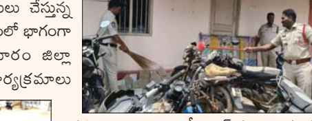
రాష్ట్ర ప్రభుత్వం ప్రతిష్టాత్మకంగా అమలు చేస్తున్న 'స్వచ్ఛ ఆంధ్ర - స్వచ్ఛ ఆంధ్ర' కార్యక్రమంలో భాగంగా తిరుపతి జిల్లా పోలీస్ శాఖ శనివారం జిల్లా వ్యాప్తంగా విస్తృతంగా స్వచ్ఛత కార్యక్రమాలు నిర్వహించింది. జిల్లా ఎస్పీ ఎల్ సుబ్బారాయుడు ఆదేశాల మేరకు పోలీస్ అధికారులు, సిబ్బంది తమ తమ పోలీస్ స్టేషన్లు, సర్కిల్ కార్యాలయాల పరిసరాలను శుభ్రపరిచి పరిశుభ్రమైన వాతావరణాన్ని కల్పించారు.

ప్రజాభూమి తిరుపతి 18: రాష్ట్ర ప్రభుత్వం ప్రతిష్టాత్మకంగా అమలు చేస్తున్న 'స్వచ్ఛ ఆంధ్ర - స్వచ్ఛ ఆంధ్ర' కార్యక్రమంలో భాగంగా తిరుపతి జిల్లా పోలీస్ శాఖ శనివారం జిల్లా వ్యాప్తంగా విస్తృతంగా స్వచ్ఛత కార్యక్రమాలు నిర్వహించింది. జిల్లా ఎస్పీ ఎల్ సుబ్బారాయుడు ఆదేశాల మేరకు పోలీస్ అధికారులు, సిబ్బంది తమ తమ పోలీస్ స్టేషన్లు, సర్కిల్ కార్యాలయాల పరిసరాలను శుభ్రపరిచి పరిశుభ్రమైన వాతావరణాన్ని కల్పించారు. స్టేషన్ ఆవరణల్లో పేరుకుపోయిన చెత్తాచెదాలను తొలగించడం, డ్రైనేజీ కాలువలను శుభ్రపరచడం, పిచ్చి మొక్కలను తొలగించడం వంటి చర్యలు చేపట్టారు. అదనంగా పర్యావరణ పరిరక్షణలో భాగంగా పచ్చదనం పెంపొందించే లక్ష్యంతో మొక్కలు నాటారు. ఈ కార్యక్రమంలో జిల్లా వ్యాప్తంగా పలువురు పోలీస్ అధికారులు, సిబ్బంది ఉత్సాహంగా పాల్గొన్నారు. పరిశుభ్రమైన పరిసరాల ఆరోగ్యకరమైన సమాజ నిర్మాణానికి దోహదం చేస్తాయని, ప్రతి ఒక్కరూ తమ వంతు బాధ్యతగా స్వచ్ఛతను పాటించాలని పోలీస్ అధికారులు సూచించారు.