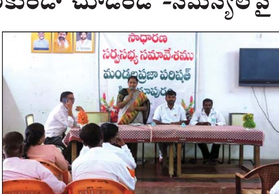
సమస్యలపై గళం విప్పిన ఎంపీటీసీలు