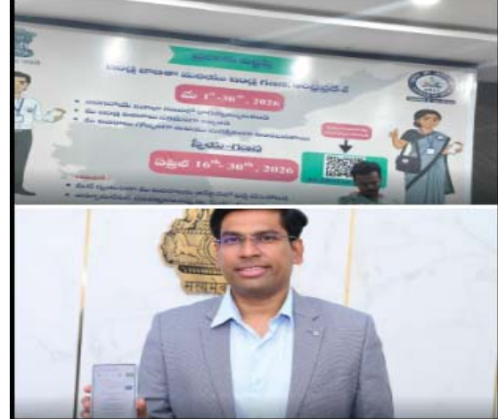
సెన్సస్కు తిరుపతి జిల్లాలో పూర్తి స్థాయి సిద్ధత

ప్రజా భూమి - తిరుపతి కలెక్టరేట్ 16 తిరుపతి జిల్లాలో జరగబోయే 2026-27 సెన్సస్ అవశేషాన్ని విజయవంతంగా నిర్వహించేందుకు జిల్లా యంత్రాంగం పూర్తిస్థాయిలో సిద్ధంగా ఉందని జిల్లా కలెక్టర్ డాక్టర్ ఎస్. వెంకటేశ్వర్ తెలిపారు. గురువారం తిరుపతి కలెక్టరేట్లోని వీడియో కాన్ఫరెన్స్ హాల్లో డీఆర్ఓ నరసింహులు, మీడియా ప్రతినిధులతో కలిసి నిర్వహించిన సమావేశంలో సెన్సస్ ఏర్పాట్లపై వివరాలు వెల్లడించారు. జిల్లాను మొత్తం 42 చార్జీలుగా విభజించి సమగ్ర వ్యవస్థల ఏర్పాటు చేసినట్లు తెలిపారు. ఇందులో 36 మండలాలు, 5 మున్సిపాలిటీలు, తిరుపతి మున్సిపల్ కార్పొరేషన్లను ప్రత్యేక చార్జీలు ఏర్పాటు చేశారు. ప్రతి చార్జీను హౌస్ లిస్టింగ్ ట్యాక్సా విభజించి, ప్రతి ట్యాక్సు ఎస్టాబ్లిష్మెంట్, పర్యవేక్షణకు సూపర్వైజర్లను నియమించారు. సెన్సస్ నిర్వహణకు సంబంధించి రాష్ట్ర స్థాయిలో శిక్షణా కార్యక్రమాలు ఇప్పటికే పూర్తయ్యాయని, జిల్లాలో చార్జీ ఆఫీసర్లకు మూడు రోజులపాటు సమగ్ర శిక్షణతో పాటు హాస్టింగ్-ఆన్ పర్మిషన్లు నిర్వహించినట్లు తెలిపారు. మార్గదర్శి, ఫీల్డ్ ట్రైనర్ల ద్వారా ఎస్టాబ్లిష్మెంట్లు, నూపర్వైజర్లకు దశల వారీగా శిక్షణ అందిస్తున్నారని, ఈ నెల 23 నుంచి తుది దశ శిక్షణ ప్రారంభమవుతుందని చెప్పారు. ఈసారి సెన్సస్ను 100 శాతం ఆన్లైన్ విధానంలో నిర్వహించడం సంవత్సరాల తరువాత తరువాత నిర్వహిస్తున్న ఈ సెన్సస్ను విజయవంతం చేయడానికి జిల్లా యంత్రాంగం చేయనున్నారని, దీని ద్వారా సమయం ఆదా కావడంతో పాటు ఖచ్చితత్వం పెరుగుతుందని