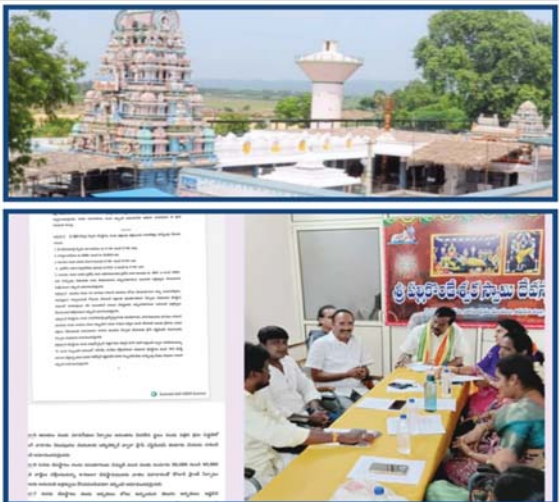
సామాన్య భక్తులను విస్తరించి... సేవ టికెట్ల ధరలు పెంచి