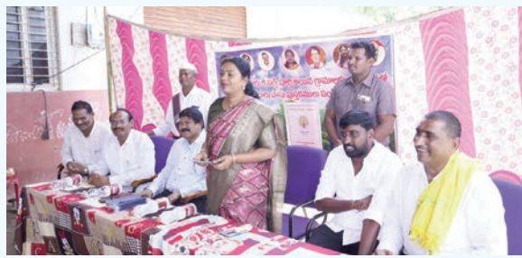
ప్రజాభూమి సామాజిక సంఘం మండల చందాపూరి గ్రామంలో మంగళవారం రీ సర్వే ప్రక్రియ పూర్తి చేసిన తర్వాత రైతులకు కొత్త పట్టాదారు పాస్పుస్తకాలు అందజేసారు. ఈ కార్యక్రమంలో ఎమ్మెల్యే తంగిరాల సౌమ్య అధికారులు, కూటమి నేతలతో కలిసి రైతులకు పాస్పుస్తకాలు అందజేశారు.

రీ సర్వే పూర్తి అయిన అనంతరం అధికారులు, కూటమి నేతలతో కలిసి పంపిణీ చేసిన ఆంధ్రప్రదేశ్ ప్రభుత్వం ఎమ్మెల్యే తంగిరాల సౌమ్య