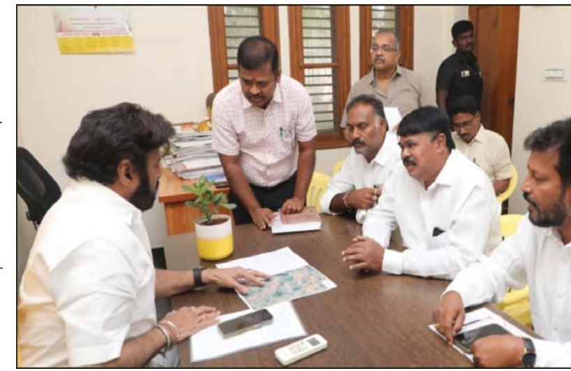
నందమూరి బాలకృష్ణను నన్నానించి కృతజ్ఞతలు తెలిపారు. ఈ కార్యక్రమంలో తెలుగుదేశం పార్టీ నాయకులు పాల్గొన్నారు.