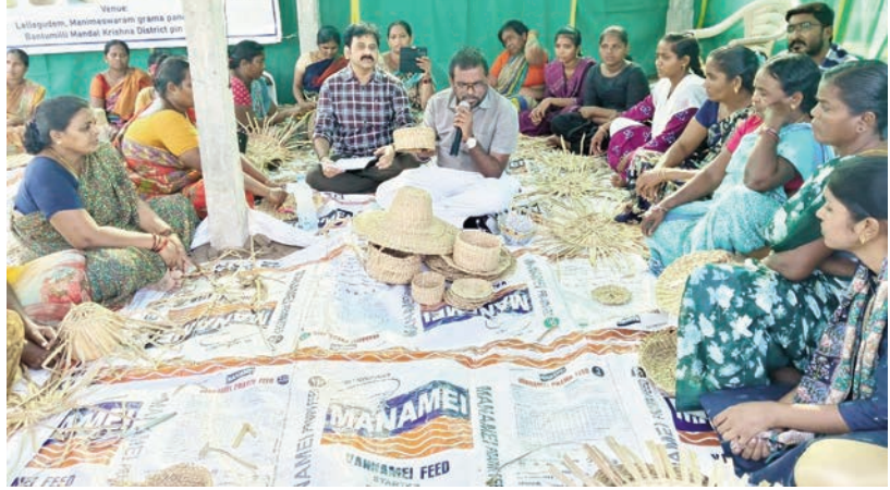
సెర్పె, డి.ఆర్.డి.వి, వెలుగు ఆధ్వర్యంలో మహిళలకు ఇస్తున్న శిక్షణ కేంద్రాలను ఆయన పరిశీలించారు. మార్కెటింగ్ భయం పోయింది: గతంలో శిక్షణ ఇప్పించడం సులభమే కానీ, మంది మహిళలు లేకపోవడమే ప్రధాన