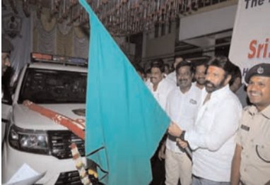
స్టోందన్నారు. హిందూపురం నియోజకవర్గంలో శాంతిభద్రతల పరిరక్షణ, పోలీసు వ్యవస్థను బలోపేతం చేయడం లక్ష్యంగా చేసుకొని, కార్పొరేట్ సహజీక బాధ్యతతో భాగంగా ముగ్గురు కార్పొరేట్ వ్యాపారాలతో చర్చించి, పోలీస్ శాఖకు వాహనాలను సమకూర్చి ఇవ్వడం జరిగిందన్నారు. గతంలో పోలీస్ శాఖకు రూ.30 లక్షలతో సీసీ కెమెరాలు ఏర్పాటు చేయడం జరిగిందని, మరో రూ.10 లక్షలతో పోలీస్ కంట్రోల్ రూమ్ ఏర్పాటు, రూ. 10 లక్షల తో మహిళా బోలీసుల సౌకర్యం మరుగుదొడ్ల ఏర్పాటులు చేశామన్నారు. నిత్యం ప్రజా భద్రత కోసం కష్టపడుతున్న పోలీస్ శాఖకు తాము ఎంత సహకరించిన తప్పవనన్నారు. అదే విధంగానే ప్రజల ఆరోగ్య భద్రత సైతం తన బాధ్యతగా ఎన్.టి.ఆర్ రథాన్ని ఏర్పాటు చేసి ప్రతిరోజూ నియోజకవర్గంలో వైద్య పరీక్షలను ఏర్పాటు చేసి