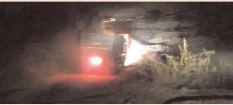
ప్రజా భూమి ప్రతినిధి-ఆగిరిపల్లి