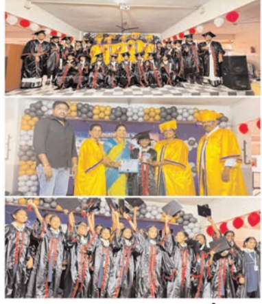
సాధించిన విజయాలను స్ఫూర్తిగా తీసుకుని, హైస్కూల్ విద్యలో కూడా విద్యార్థులందరూ అంకితభంతో చదివి ఆత్మస్వత శిఖరాలను అధిరోపించాలని ఆశాభావం వ్యక్తం చేశారు. విద్యార్థులు క్రమశిక్షణతో కూడిన విద్యను అభ్యసిస్తూ వారిని తగిన విధంగా ప్రోత్సహి

ప్రజా భూమి ప్రతినిధి-నిడదవోలు నిడదవోలు స్థానిక రామ్ నగర్ నారాయణ ఒలింపియాడ్ స్కూల్లో ప్రైమరీ విద్యను పూర్తి చేసుకుని హైస్కూల్ విద్యలోకి అడుగుపెడుతున్న 5వ తరగతి విద్యార్థులకు గ్రాడ్యుయేషన్ డే వేడుకలను అత్యంత వైభవంగా నిర్వహించారు. ఈ వేడుకలో ముఖ్య అతిథిగా విచ్చేసిన క్లస్టర్ ప్రిన్సిపాల్ విద్యార్థులకు గ్రాడ్యుయేషన్ డే సర్టిఫికెట్లు, మెమోంటోలు మరియు స్నాతకోత్సవ పట్టాలను అందజేసి వారిని అభినందించారు. ఈ సందర్భంగా వారు మాట్లాడుతూ, పాఠశాల స్థాయిలో ఇటువంటి కార్యక్రమాలు నిర్వహించడం వల్ల విద్యార్థుల్లో చదువు పట్ల మరింత ఆసక్తి పెరగడమే కాకుండా, వారిలో డాగి ఉన్న ప్రతిభ బయటకు వస్తుందని, ఇది భవిష్యత్తులో వారి ఆత్మవిశ్వాసాన్ని అధిరోపించాలని ఆశాభావం వ్యక్తం చేశారు. పెంపొందించడానికి ఎంతో తోడ్పడుతుందని హార్షం వ్యక్తం చేశారు. ప్రైమరీ విద్యలో