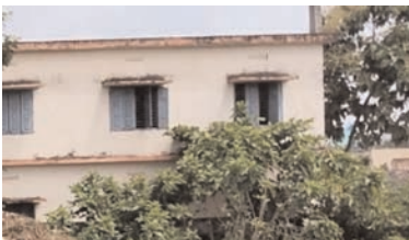
అంత తీసుకోచ్చి స్కూల్ ఆవరణలో వేయడం పట్ల పంచాయతీ అధికారులు పనితీరు కక్షకు కట్టిపట్ట కనిపిస్తుంది..

ప్రజాభూమి ప్రతినధి - ప్రత్తిపాడు కాకినాడ జిల్లా ప్రత్తిపాడు నియోజకవర్గం ఏలేశ్వరం మండలం సిరిపురం గ్రామంలో సుమారు 30 సంవత్సరాల పైబడి కోనసాగు తున్న స్థానిక జిల్లా పరిషత్ హై స్కూల్ నందు కనీస పనులకు సైతం నోచుకేకపోవడం విద్యార్థిని విద్యార్థులకి సైతం అంతచిక్కని సమస్యగా మారింది. వివరాల్లోకి వెళితే స్థానిక హై స్కూల్ నందు గ్రామం లో విద్యార్థిని విద్యా ర్థులే కాకుండా చుట్టుపక్కల గ్రామాలనుంచి సుమారు 400కు పైబడి స్కూల్ నందు చదువుతున్నారు. గ్రామంలో దంపింగ్ యార్డ్ లేక స్కూలు ఆవరణ చుట్టూ కుప్పలు తప్పే లుగా చెత్తను వేయడం వల్ల విద్యార్థిని విద్యార్థుల అనారోగ్యానికి శాపంగా మారుతుంది. ప్రధానంగా విద్యార్థులకు బాట్రూం వ్యవస్థ లేక స్కూలు ఆవరణ చుట్టూ కుప్పలు తప్పే లుగా చెత్తను వేయడం వల్ల విద్యార్థిని విద్యార్థుల అనారోగ్యానికి శాపంగా మారుతుంది. ప్రధానంగా విద్యార్థులకు బాట్రూం వ్యవస్థ లేక స్కూలు ఆవరణ చుట్టూ కుప్పలు తప్పే లుగా చెత్తను వేయడం వల్ల, అర కొర ఉన్నప్పటికీ శుభ్రత లోపించడం వల్ల విద్యార్థిని విద్యార్థులు తీవ్ర ఇబ్బందులకు గురవుతున్నారు. టైంకి వచ్చామా... పాతలు చెప్పామా జిల్లా తీసుకున్నారా టైంకి వెళ్ళిపోయామా.. అన్నట్లు యిల్ల వైఖరి ఒకవైపు, ఎన్నిసార్లు కంప్లెట్ ఇచ్చిన సరే పట్టించుకోని అధికారుల వైఖరి మరోవైపు. ప్రభుత్వం విద్యార్థిని విద్యార్థులకు అందించే నాటి అమ్మడి నుంచి నేటి తల్లి కి వందనం వరకు ఇచ్చే 15 వేలు కి 2 వేలు ప్రత్యేకించి స్కూల్లో మరమ్మత్తుల కోసం అన్ని స్కూల్ శుభ్రత కోసం అని తీసుకుంటున్న డబ్బులు ఏమైపోతున్నట్లు.. నూలు ఆవరణలో పెట్టిన సిసి కెమెరాలు ఏమయ్యాయి.. అసలు విద్యార్థిని విద్యార్థుల పట్ల శ్రద్ధ వహించని స్కూల్ యాజమాన్యంపై ఆగ్రహం వ్యక్తం చేస్తున్న తల్లిదండ్రులు.. గ్రామంలో ఉన్న చెత్తని