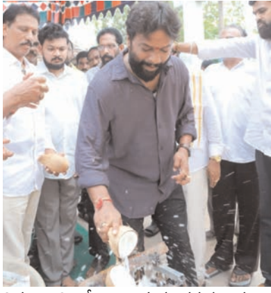
నిధులు 3 కోట్లు, రామచంద్రవరం పట్టణ అభివృద్ధికి మున్సిపల్ శాఖ మంత్రి పాం