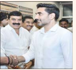
మంత్రి నారా లోకేష్ కు ప్రత్యేకంగా స్వాగతం పలికారు. మంత్రి నారా లోకేష్ మాట్లాడుతూ గత ప్రభుత్వం రాష్ట్రంలో విద్యుత్తును పాలన జరిగిందన్నారు. రాష్ట్ర ముఖ్యమంత్రి నారా చంద్రబాబు నాయుడు నేతృత్వంలో కూటమి ప్రభుత్వం అధికారంలోకి వచ్చిన తదుపరి ఎన్నో ప్రాజెక్టులకు శంకుస్థాపనలు చేస్తూ అభివృద్ధి అనేది పురోగమ దిశగా వెళుతున్నదన్నారు. 20 లక్షల ఉద్యోగ అవకాశాలు కల్పిస్తామనే మాట ఇచ్చినప్పటికీ 50 లక్షల ఉద్యోగ అవకాశాలు కల్పించే దిశగా ప్రభుత్వం కృషిచేస్తున్నదన్నారు. గత 20 మాసాల్లో 6.3 లక్షల ఉద్యోగాలను కల్పించడం జరిగిందన్నారు.

ఢిల్లీ పర్యటనకై విచ్చేసిన రాష్ట్ర ఐటీ, విద్యా శాఖల మంత్రి నారా లోకేష్ కి బుధవారం ఆంధ్రప్రదేశ్ పార్లమెంటు సభ్యులు ఘన స్వాగతం పలికడం జరిగిందన్నారు. అనంతపురం పార్లమెంటు సభ్యులు అందిగా లక్ష్మీనారాయణ విద్యా శాఖ