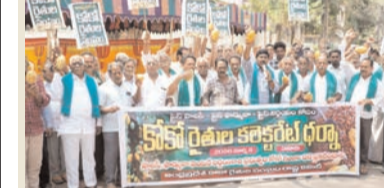
ప్రజా భూమి ప్రతినిధి-ఏలూరు

కోకో గింజల ధర తగ్గింపును నిరసిస్తూ కోకో రైతులు బుధవారం ఏలూరు కలెక్టరేట్ ముందు ధర్నా నిర్వహించారు. ఆంధ్రప్రదేశ్ కోకో రైతుల సంఘం ఆధ్వర్యంలో రైతులు కోకో కాయలతో నిరసన తెలిపారు. అనంతరం కలెక్టరేట్ నుండి జిల్లా ఉద్యాన శాఖ కార్యాలయం వరకు ర్యాలీ చేపట్టారు. కోకో గింజలకు ఆయిల్ పామ్ మార్కెటింగ్ ప్రెస్ పాలసీ, ప్రెస్ ఫార్ములా వెంటనే ప్రకటించాలని డిమాండ్ చేశారు. విదేశీ కోకో గింజల దిగుమతులను నిలిపివేయాలని కోరారు. రైతుల వద్ద ఉన్న కోకో గింజలను వెంటనే కొనుగోలు చేయాలని ప్రభుత్వాన్ని డిమాండ్ చేశారు. కంపెనీలు నిండికేట్ గా మారి ధరలు తగ్గిస్తున్నాయని నాయకులు ఆరోపించారు. కిలో కోకో గింజలకు కనీసం రూ.500 ధర కల్పించాలని కోరారు. అనంతరం జాయింట్ కలెక్టరీ కలెక్టరీ పవిత్రం అందజేశారు. ఈ కార్యక్రమంలో పలువురు రైతు సంఘం నాయకులు పాల్గొన్నారు.