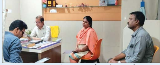
ఫిర్యాదులు కూడా తమ దృష్టికి వచ్చినట్లు తెలిపారు. దీనిపై పూర్తిస్థాయి విచారణ కోసం ప్రత్యేక కమిటీని ఏర్పాటు చేసి, అన్ని అంశాలను పరిశీలించిన తర్వాత తగిన చర్యలు తీసుకుంటామని పేర్కొన్నారు.