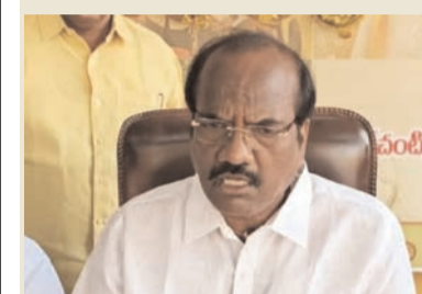
ప్రజా భూమి ప్రతినిధి-ఏలూరు