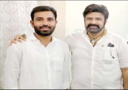
హిందూపురం అసెంబ్లీ నియోజకవర్గ తెలుగుదేశం పార్టీ అనుబంధ కమిటీలను నియమించినట్లు స్థానిక ఎమ్మెల్యే కార్యాలయం ఒక ప్రకటనలో పేర్కొంది.