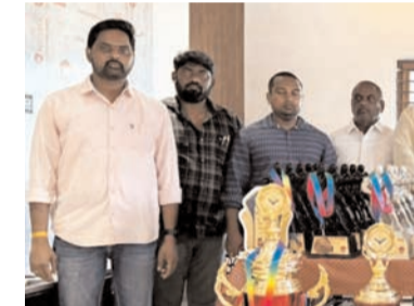
అలాగే ఈ విభాగాల్లో మొదటి స్థానం లో నిలిచిన క్రీడాకారులకి చాంపియన్ ఆఫ్ చాంపియన్ రౌండ్ జరుగుతుందని అందులో మొదటి బహుమతిగా 40వేల నగదు మరియు ట్రోఫీ, రెండవ స్థానానికి 20వేల నగదు మరియు ట్రోఫీ అందజేయడం జరుగుతుందని పేర్కొన్నారు.ఈ పోటీలకి న్యాయ నిర్ణేతలగా