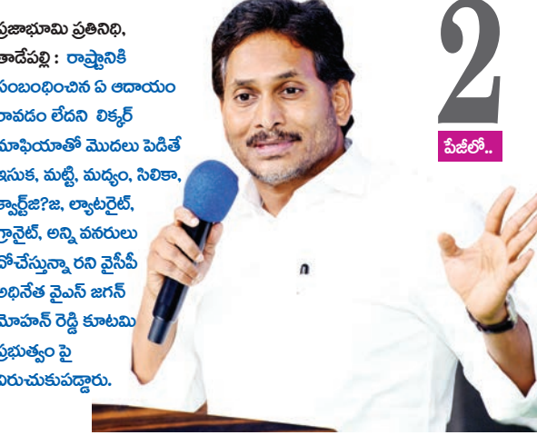
ప్రజాభూమి ప్రతినిధి, తాడేపల్లి : రాష్ట్రానికి సంబంధించిన ఏ అదాయం రావడం లేదని లెక్క మాఫియాలో ముదలు పెడితే ఇసుక, మట్టి, మద్యం, సిలికా, క్వార్ట్జ్, అల్మట్, గ్రానైట్, అన్ని వనరులు దోచుకున్నారని వైసీపీ అధినేత వైయస్ జగన్ మోహన్ రెడ్డి కూటమి ప్రభుత్వం పై విరుచుకుపడ్డారు.