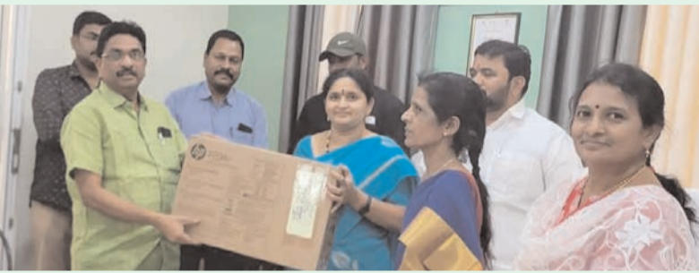
ప్రజాభూమి ప్రతినిధి-ఏలూరు జిల్లా