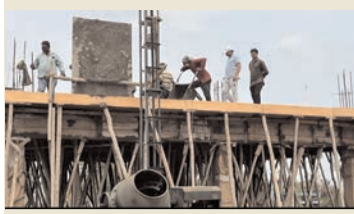
ప్రజా భూమి ప్రతినిధి-జిల్లాగుమ్మి

జిల్లాగుమ్మి మండల కేంద్రంలో నిర్మాణం కాబోతున్న అన్నా క్యాంపేన్ స్టలాన్ని పోలవరం శాసనసభ్యులు చిల్ర బాలరాజు సందర్శించి పనుల పురోగతిని పరిశీలించారు. ఈ సందర్భంగా సంబంధిత అధికారులతో కలిసి నిర్మాణ పనుల వివరాలను తెలుసుకుని పనులు వేగవంతంగా చేపట్టాలని సూచించారు. ప్రజలకు త్వరితగతిన సేవలు అందేలా పనులు నాణ్యతతో పూర్తి చేయాలని అధికారులను ఆదేశించారు. అనంతరం ఎమ్మెల్యే మాట్లాడుతూ పేదలు, కార్మికులు, రోజువారీ కూలీలు, నియోజకవర్గాలకు తక్కువ ధరలో పోషకాహార భోజనం అందించడమే అన్నా క్యాంపేన్ ప్రధాన లక్ష్యమని తెలిపారు. రాష్ట్ర ప్రభుత్వం ప్రజల సంక్షేమాన్ని దృష్టిలో ఉంచుకుని అన్నా క్యాంపేన్లను తిరిగి ప్రారంభించి మరిన్ని ప్రాంతాలకు విస్తరిస్తోందన్నారు. ఈ క్యాంపేన్ ప్రారంభం ద్వారా జిల్లాగుమ్మి ప్రాంత ప్రజలకు ఎంతో ఉపయోగకరంగా ఉండబోతుందని చెప్పారు. అన్నా క్యాంపేన్ పూర్తయ్యాక ప్రతి రోజు వందలాది మంది పేదలకు తక్కువ ధరలో నాణ్యమైన ఆహారం అందుతుందని తెలిపారు. ప్రభుత్వం చేపడుతున్న సంక్షేమ కార్యక్రమాలు ప్రతి అర్హుడికి చేరాలా తాము కృషి చేస్తామని ఎమ్మెల్యే స్పష్టం చేశారు.