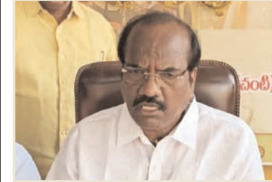
ప్రజా భూమి ప్రతినిధి-ఏలూరు