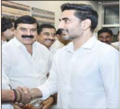
మంత్రి నారా లోకేష్ కు ప్రత్యేకంగా స్వాగతం పలికారు. మంత్రి నారా లోకేష్ మాట్లాడుతూ గత ప్రభుత్వం రాష్ట్రంలో విద్యుత్తును పాలన జరిగిందన్నారు. రాష్ట్ర ముఖ్యమంత్రి నారా చంద్రబాబు నాయుడు నేతృత్వంలో కూటమి ప్రభుత్వం అధికారంలోకి వచ్చిన తదుపరి ఎన్నో ప్రాజెక్టులకు శంకుస్థాపనలు చేస్తూ అభివృద్ధి అనేది పురోగమ దిశగా వెళుతున్నదన్నారు. 20 లక్షల ఉద్యోగ అవకాశాలు కల్పిస్తామనే మాట ఇచ్చినప్పటికీ 50 లక్షల ఉద్యోగ అవకాశాలు కల్పించే దిశగా ప్రభుత్వం కృషిచేస్తున్నదన్నారు. గత 20 మాసాల్లో 6.3 లక్షల ఉద్యోగాలను కల్పించడం జరిగిందన్నారు.

ఢిల్లీ పర్యటనకై విచ్చేసిన రాష్ట్ర ఐటీ, విద్యా శాఖల మంత్రి నారా లోకేష్ కి బుధవారం ఆంధ్రప్రదేశ్ పార్లమెంటు సభ్యులు ఘన స్వాగతం పలికడం జరిగిందన్నారు. అనంతపురం పార్లమెంటు సభ్యులు అందిగా లక్ష్మీనారాయణ విద్యా శాఖ