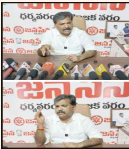
జనసేన పార్టీ కార్యకర్తలు, అభిమానులు తప్పనిసరిగా సభ్యత్వం నమోదు చేసుకోవాలని పిలుపునిచ్చారు. సభ్యత్వ నమోదు కార్యక్రమాన్ని ప్రతి నియోజకవర్గంలో పండుగ వాతావరణంలో నిర్వహించి ఒక వేడుకలా ముందుకు తీసుకెళ్లాలని కోరుతూ రాయలసీమలోని ప్రతి నియోజకవర్గంలో కనీసం 10 వేల సభ్యత్వాల నమోదు చేయడానికి లక్ష్యాగా పెట్టుకోవాలని తెలిపారు. రాష్ట్ర వ్యాప్తంగా మొత్తం 40 లక్షల నుండి 50 లక్షల వరకు సభ్యత్వాల నమోదు అయ్యే దిశగా కృషి చేస్తున్నామని పేర్కొన్నారు. సభ్యత్వం పొందిన వారికి రోడ్డు ప్రమాదం జరిగితే రూ.5 లక్షల బీమా సౌకర్యం ఉంటుందని ఆయన వివరించారు. కొత్తగా చేరాలనుకునే వారు స్థానిక వాలంటీర్లను సంప్రదించి ఈ అవకాశాన్ని వినియోగించుకోవాలని ఆయన కోరారు. ముఖ్యంగా పవన్ కళ్యాణ్ వైసీపీ ప్రభుత్వాన్ని అరంభించిన తొక్కోతారన్నారు. కేవలం వైసీపీకి 11 సీట్లకు మాత్రమే పరిమితం అయ్యారు. ఇచ్చిన హామీలను నెరవేర్చుకుంటూ కూటమి ప్రభుత్వం పని చేస్తుందన్నారు. ఇలాగే మరోక 15 సంవత్సరాలు కూటమి ప్రభుత్వం కలిసి పని చేస్తుందన్నారు.

జనసేన పార్టీ సభ్యత్వ నమోదు ప్రక్రియ ఈ నెల 17వ తేదీ వరకు పొడిగించినట్లు జనసేన పార్టీ రాష్ట్ర ప్రధాన కార్యదర్శి చిలకం మధుసూదన్ రెడ్డి తెలిపారు. ధర్మవరంలోని జనసేన పార్టీ కార్యాలయంలో ఆయన మాట్లాడుతూ.. జనసేన అధినేత పవన్ కళ్యాణ్ ఆదేశాల మేరకు వారం రోజులు గడువు పెంచామన్నారు. ఉమ్మడి అనంతపురం జిల్లాలో సహజ రాష్ట్ర వ్యాప్తంగా ఉన్న జనసేన పార్టీ కార్యకర్తలు, అభిమానులు తప్పనిసరిగా సభ్యత్వం నమోదు చేసుకోవాలని పిలుపునిచ్చారు. సభ్యత్వ నమోదు కార్యక్రమాన్ని ప్రతి నియోజకవర్గంలో పండుగ వాతావరణంలో నిర్వహించి ఒక వేడుకలా ముందుకు తీసుకెళ్లాలని కోరుతూ రాయలసీమలోని ప్రతి నియోజకవర్గంలో కనీసం 10 వేల సభ్యత్వాల నమోదు చేయడానికి లక్ష్యాగా పెట్టుకోవాలని తెలిపారు. రాష్ట్ర వ్యాప్తంగా మొత్తం 40 లక్షల నుండి 50 లక్షల వరకు సభ్యత్వాల నమోదు అయ్యే దిశగా కృషి చేస్తున్నామని పేర్కొన్నారు. సభ్యత్వం పొందిన వారికి రోడ్డు ప్రమాదం జరిగితే రూ.5 లక్షల బీమా సౌకర్యం ఉంటుందని ఆయన వివరించారు. కొత్తగా చేరాలనుకునే వారు స్థానిక వాలంటీర్లను సంప్రదించి ఈ అవకాశాన్ని వినియోగించుకోవాలని ఆయన కోరారు. ముఖ్యంగా పవన్ కళ్యాణ్ వైసీపీ ప్రభుత్వాన్ని అరంభించిన తొక్కోతారన్నారు. కేవలం వైసీపీకి 11 సీట్లకు మాత్రమే పరిమితం అయ్యారు. ఇచ్చిన హామీలను నెరవేర్చుకుంటూ కూటమి ప్రభుత్వం పని చేస్తుందన్నారు. ఇలాగే మరోక 15 సంవత్సరాలు కూటమి ప్రభుత్వం కలిసి పని చేస్తుందన్నారు.