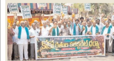
ప్రజా భూమి ప్రతినిధి-ఏలూరు

కోకో గింజల ధర తగ్గింపును నిరసిస్తూ కోకో రైతులు బుధవారం ఏలూరు కలెక్టరేట్ ముందు ధర్నా నిర్వహించారు. ఆంధ్రప్రదేశ్ కోకో రైతుల సంఘం ఆధ్వర్యంలో రైతులు కోకో కాయలతో నిరసన తెలిపారు. అనంతరం కలెక్టరేట్ నుండి జిల్లా ఉద్యాన శాఖ కార్యాలయం వరకు ర్యాలీ చేపట్టారు. కోకో గింజలకు అయిల్ పామ్ మార్కెటింగ్ ప్రైవేట్ లిమిటెడ్, ప్రైవేట్ ఫార్ములారా వెంటనే ప్రకటించాలని డిమాండ్ చేశారు. ఏడేటి కోకో గింజల దిగుమతులను నిలిపివేయాలని కోరారు. రైతుల వద్ద ఉన్న కోకో గింజలను వెంటనే కొనుగోలు చేయాలని ప్రభుత్వాన్ని డిమాండ్ చేశారు. కంపెనీలు నుండి కోకో గింజల తగ్గింపును నిరసిస్తూ ఏలూరు కలెక్టరేట్ కిలో కోకో గింజలకు కనీసం రూ.500 ధర కల్పించాలని కోరారు. అనంతరం జాయింట్ కలెక్టరేట్ కలెక్టరు వివేక పత్రం అందజేశారు. ఈ కార్యక్రమంలో పలువురు రైతు సంఘం నాయకులు పాల్గొన్నారు.