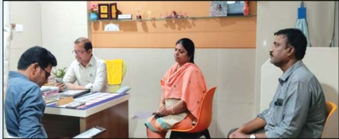
ఫిర్యాదులు కూడా తమ దృష్టికి వచ్చినట్లు తెలిపారు. దీనిపై పూర్తిస్థాయి విచారణ కోసం ప్రత్యేక కమిటీని ఏర్పాటు చేసి, అన్ని అంశాలను పరిశీలించిన తర్వాత తగిన చర్యలు తీసుకుంటామని పేర్కొన్నారు.

లేకుండా నడుస్తున్నట్లు గుర్తించామని వెల్లడించారు. కొన్ని చోట్ల అర్హత కలిగిన వైద్యులు ఉన్నప్పటికీ డిస్టిక్ట్ ఆథారిటీ వద్ద అవసరమైన రిజిస్ట్రేషన్ లేనివారినీ గుర్తించామని తెలిపారు. అలాగే పాలిటెస్ట్ కంట్రోల్ షాట్, బయోమెడికల్ వ్యర్థాల నిర్వహణకు సంబంధించిన ఆసుపత్రులు కూడా కొన్ని ఆసుపత్రులు పొందలేదని పేర్కొన్నారు. నిబంధనల పాటించని ఆసుపత్రులకు షోకాట్ నోటీసులు జారీ చేయనున్నట్లు ఆయన తెలిపారు. అవసరమైన ఆసుపత్రులు లేకుండా వైద్య సేవలు అందిస్తే సంబంధిత ఆసుపత్రులపై చట్టపరమైన చర్యలు తీసుకుంటామని హెచ్చరించారు. ఒక ఆసుపత్రి విషయంలో రిజిస్ట్రేషన్ ప్రక్రియలో భాగంగా ఆన్లైన్లో దరఖాస్తు చేసినట్లు సమాచారం ఇచ్చారు. దానిని పరిశీలించి అవసరమైతే జిల్లా కలెక్టర్ ఆసుపత్రిలో రిజిస్ట్రేషన్ మంజూరు చేసి ప్రక్రియ కొనసాగుతుందని చెప్పారు. అదేవిధంగా ఒక ప్రైవేట్ ఆసుపత్రిలో నకిలీ వైద్యులు సేవలందిస్తున్నారనే ఆరోపణలు కూడా తమ దృష్టికి వచ్చినట్లు తెలిపారు. దీనిపై పూర్తిస్థాయి విచారణ కోసం ప్రత్యేక కమిటీని ఏర్పాటు చేసి, అన్ని అంశాలను పరిశీలించిన తర్వాత తగిన చర్యలు తీసుకుంటామని పేర్కొన్నారు. ప్రైవేట్ ఆసుపత్రులు నిబంధనల పాటించిన ప్రజలకు నాణ్యమైన వైద్య సేవలు అందించాలని బాధ్యత ఉందని డీఎంహెచ్వో అన్నారు. ఆసుపత్రులు లేకుండా ఆసుపత్రులు నడిపితే కఠిన చర్యలు తప్పవని హెచ్చరించారు. ప్రజలు కూడా ఆసుపత్రులను పనిచేస్తున్న ఆసుపత్రుల గురించి వైద్య శాఖకు సమాచారం అందించాలని డీఎంహెచ్వో బాలకృష్ణ నాయక్ కోరారు. ఈ కార్యక్రమంలో రేణిగుంట పి,హెచ్,సీ, చక్రపాణి, డాక్టర్ చిత్ర ప్రకాశ్ రెడ్డి, వైద్య సిబ్బంది తదితరులు పాల్గొన్నారు.