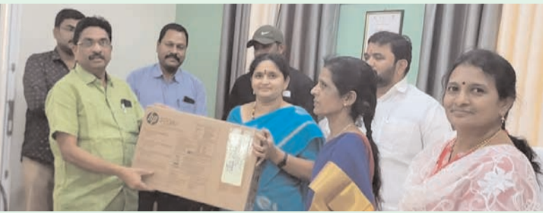
ప్రజాభూమి ప్రతినిధి-ఏలూరు జిల్లా