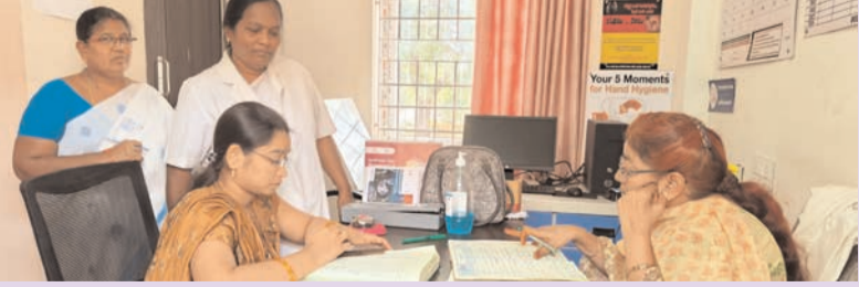
ప్రజా భూమి ప్రతినిధి - ఆగిరిపల్లి

- మెరుగైన వైద్య సేవలకు చర్యలు తీసుకోండి -- డాక్టర్ పద్మావతి