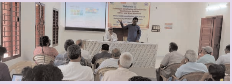
ప్రజా భూమి ప్రతినిధి - ఆగిరిపల్లి