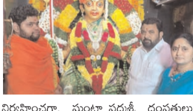
ప్రజాభూమి ప్రతినిధి-ఏలూరు జిల్లా