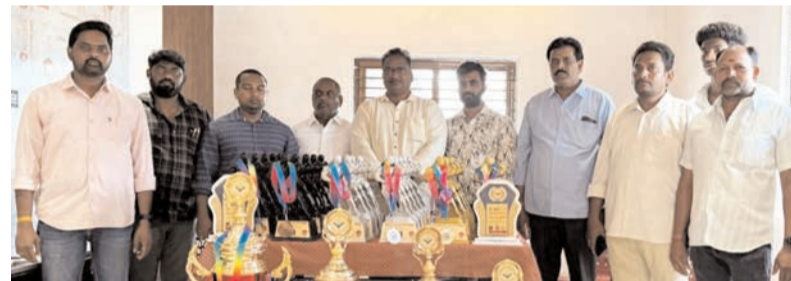
అలాగే ఈ విభాగాల్లో మొదటి స్థానం లో నిలిచిన క్రీడాకారులకి చాంపియన్ ఆఫ్ చాంపియన్ రౌండ్ జరుగుతుందని అందులో మొదటి బహుమతిగా 40వేల నగదు మరియు ట్రోఫీ, రెండవ స్థానానికి 20వేల నగదు మరియు ట్రోఫీ అందజేయడం జరుగుతుందని పేర్కొన్నారు. ఈ పోటీలకి న్యాయ నిర్ణేతగా