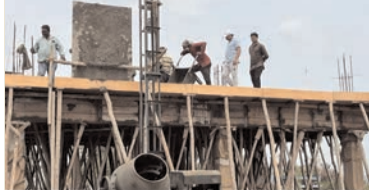
ప్రజా భూమి ప్రతినిధి-జిల్లాగుమ్మి

జిల్లాగుమ్మి మండల కేంద్రంలో నిర్మాణం కాబోతున్న అన్నా క్యాంపేన్ స్టలాన్ని పోలవరం శాసనసభ్యులు చిల్ర బాలరాజు సందర్శించి పనుల పురోగతిని పరిశీలించారు. ఈ సందర్భంగా సంబంధిత అధికారులతో కలిసి నిర్మాణ పనుల వివరాలను తెలుసుకుని పనులు వేగవంతంగా చేపట్టాలని సూచించారు. ప్రజలకు త్వరితగతిన సేవలు అందేలా పనులు నాణ్యతతో పూర్తి చేయాలని అధికారులను ఆదేశించారు. అనంతరం ఎమ్మెల్యే మాట్లాడుతూ పేదలు, కార్యకులు, రోజువారీ కూలీలు, నియోజకవర్గాలకు తక్కువ ధరలో పోషకాహార భోజనం అందించడమే అన్నా క్యాంపేన్ ప్రధాన లక్ష్యమని తెలిపారు. రాష్ట్ర ప్రభుత్వం ప్రజల సంక్షేమాన్ని దృష్టిలో ఉంచుకుని అన్నా క్యాంపేన్లను తిరిగి ప్రారంభించి మరిన్ని ప్రాంతాలకు విస్తరిస్తోందన్నారు. ఈ క్యాంపేన్ ప్రారంభం ద్వారా జిల్లాగుమ్మి ప్రాంత ప్రజలకు ఎంతో ఉపయోగకరంగా ఉండబోతుందని చెప్పారు. అన్నా క్యాంపేన్ పూర్తయ్యాక ప్రతి రోజు వందలాది మంది పేదలకు తక్కువ ధరలో నాణ్యమైన ఆహారం అందుతుందని తెలిపారు. ప్రభుత్వం చేపడుతున్న సంక్షేమ కార్యక్రమాలు ప్రతి అర్హుడికి చేరేలా తాము కృషి చేస్తామని ఎమ్మెల్యే స్పష్టం చేశారు.