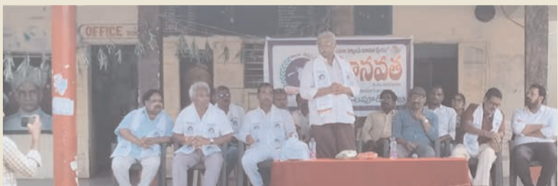
ప్రజా భూమి ప్రతినిధి-కామవరపుకోట