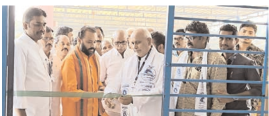
ప్రజాభూమి ప్రతినిధి - కాళ్ళపాడి