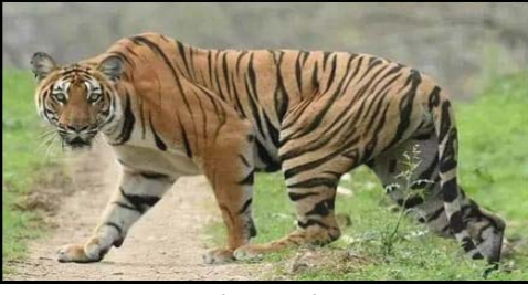
ప్రజా భూమి ప్రతినిధి: కిర్లంపూడి