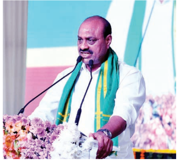
తప్పించుకునే ప్రయత్నాలు ఎంత చేసినా నిజం దాగదని, బాధ్యులపై కఠిన చర్యలు తప్పవని ఆచ్చెన్నాయుద్ధ స్పష్టం చేశారు.

ఆరోపణలు తీసుకురావడం, నిజాలను వక్రీకరించడం అత్యంత ఖండనీయం అని పేర్కొన్నారు. ఆధారాలు లేని ఆరోపణలతో ప్రజల విశ్వాసాన్ని దెబ్బతీయాలనుకోవడం రాజకీయ దిగజారుడుతనం అని విమర్శించారు. హెరిటేజ్ ఇమ్ప్రూవ్మెంట్ వైసీపీ చేస్తున్న ఆరోపణలకు ఒక్క ఆధారం అయినా చూపించగలరా? అని మంత్రి సూటిగా ప్రశ్నించారు. కల్తీతో ఎలాంటి సంబంధం లేని హెరిటేజ్ సంస్కృతి పేరును లాగడం ద్వారా అసలు అంతం నుంచి ప్రజల దృష్టిని మళ్లించాలనే ప్రయత్నం చేస్తున్నారని అన్నారు. ఆధారాలేని ఆరోపణలు చేసే చట్టపరంగా, నైతికంగా సమాధానం చెప్పాల్సిందే అని హెచ్చరించారు. అదే విధంగా, వైపి జగన్ మోహన్ రెడ్డి తిరుమల శ్రీవారి ఆలయానికి వెళ్లి డిక్షరేషన్ ఎందుకు ఇవ్వడం లేదు? అని మంత్రి ప్రశ్నించారు. హిందూ సంప్రదాయాలపై మాట్లాడే నైతిక హక్కు వైసీపీకి లేదని, ఎందుకంటే హిందువుల మనోభావాలను దెబ్బతీసింది ఎవరో రాష్ట్ర ప్రజలందరికీ స్పష్టంగా తెలుసు అని వ్యాఖ్యానించారు. తిరుమల తిరుపతి దేవస్థానాలు వంటి పవిత్ర సంస్థల ప్రతిష్ఠను దెబ్బతీయడానికి వైసీపీ చేస్తున్న ప్రయత్నాలను ప్రజలు ఎప్పటికీ క్షమించరని మంత్రి హెచ్చరించారు. తిరుమల లడ్డా ప్రసారంలో కల్తీ జరిగిందని ఒప్పుకున్న వాస్తవం నుంచి