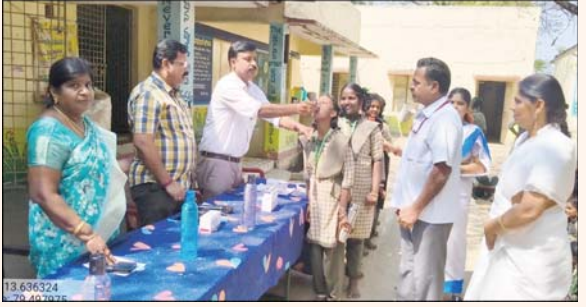
ప్రజా భూమి ప్రతినిధి: రేణిగుంట