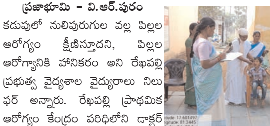
ప్రజాభూమి - వి.ఆర్.పురం

కడుపులో సులిపురుగుల వల్ల పిల్లల ఆరోగ్యం క్షీణిస్తుందని, పిల్లల ఆరోగ్యానికి హానికరం అని రేఖపల్లి ప్రభుత్వ వైద్యశాల వైద్యురాలు నిలు అభి అన్నారు. రేఖపల్లి ప్రాథమిక ఆరోగ్య కేంద్రం పరిధిలోని డాక్టర్ నిలు ఫర్ ఆధ్వర్యంలో మంగళవారం అన్ని సవివాలయాలా పరిధిలో వున్నా అన్ని గ్రామాలలో ఉన్నటు వంటి పాఠశాలలు, కాలేజీలు మరియు అంగనవాడి సెంటర్ లో వున్నా పిల్లలకు (జాతీయ సులిపురుగుల నివారణ దినోత్సవం ) ఆర్కెండ్ జోన్ మాత్రమే మింగించారు. ఈ కార్యక్రమాన్ని ఉద్దేశించి వైద్యురాలు మాట్లాడుతూ 1నుండి 2 సంవత్సరాల పిల్లలకు ఆర్కెండ్ జోన్ మాత్రం టాబ్లెట్ అర ముక్కు వెయ్యాలి, అలాగే 2నుండి 19సంవత్సరాల పిల్లలకు పూర్తి మాత్ర చేయాలని, ఈ మాత్రను కొద్ది చెప్ప చెప్పించి సవ్యాధి నీళ్లతో మింగాలని, మల మాత్రం విసర్జన బయట ప్రాంతంలో చేయకూడదని, మరుగు దొడ్లను వాడుకోవాలని పరిసరాల పరిశుభ్రత పాటించాలని అన్నారు. పిల్లలు అటలు అటలు తరువాత సబ్బుతో చేతులు కడుక్కోవాలని, బయటకు వెళ్ళేటప్పుడు చెప్పులు దరించాలని, చెప్పులు చేసుకోకపోతే శర్మం ద్వారా, మన గోధున లో వున్నా మట్టి ద్వారా మన శరీరంలో ప్రవేశించి, మనం తిన్న ఆహారం ఇవి తినేసి మనకు కడుపులో నొప్పి, వాంతులు, విరోచనాలు, నీరసం వంటి లక్షణాలు వస్తాయని, కావున పిల్లలందరూ 6నెలలకు ఒక్కసారి ఈ ఎస్ డి డి గ్రామ్ ఫిబ్రవరి లో మరయు ఆగస్టు నెలలో ఉంటుందని ఈ కార్యక్రమాన్ని సద్వినియోగం చేసుకోవాలని తెలిపారు. ఈకార్యక్రమంలో ఏఎన్ఎ లు మహేశ్వర్, శశికల, లక్ష్మి, పార్వతి, హెల్త్ అసిస్టెంట్స్, శ్రీనివాస్, రాత్రియ్య, సతీష్ సత్యనారాయణ, ఎంఎల్ హెచ్ లు పోషి, మంగ, పవన్, అనుష్, ఆశలు లు, డీవర్, అంగన్వాడీ డీవర్ తదితరులు పాల్గొన్నారు.