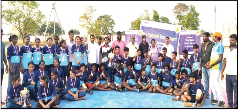
ప్రజా భూమి ప్రతినిధి తడ