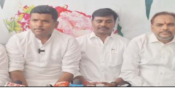
ప్రజా భూమి ప్రతినిధి కిర్లంపూడి

ఎన్నికల్లో ఇచ్చిన హామీలు నెరవేర్చలేని కూటమి. నిరుద్యోగ భృతి ఇస్తానన్న చంద్రబాబు నాయుడు.. 50 సంవత్సరాలకే పెన్షన్ మంజూరు చేస్తానన్న కూటమి ప్రభుత్వం. కూటమి ప్రభుత్వం ఇచ్చిన హామీలు నీటి మూటలే... మాజీ మంత్రి గుడివాడ అమర్నాథ్