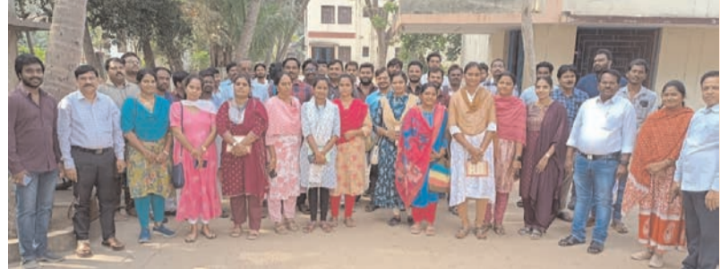
ప్రజా భూమి ప్రతినిధి-పెదపాడు

వట్లూరు గ్రామ పంచాయతీని సందర్శించిన పంచాయతీ అభివృద్ధి అధికారులు.