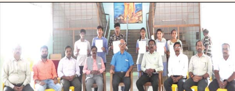
ప్రజాభూమి, హిందూపురం టౌన్