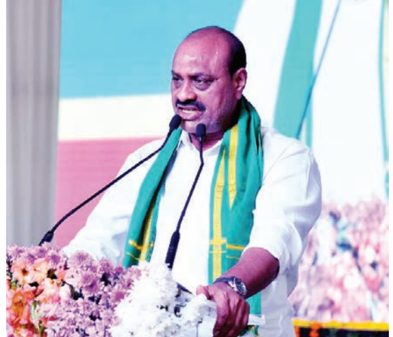
తప్పించుకునే ప్రయత్నాలు ఎంత చేసినా నిజం దాగదని, బాధ్యులపై కఠిన చర్యలు తప్పవని ఆచ్చెన్నాయుడు స్పష్టం చేశారు.

ఆరోపణలు తీసుకురావడం, నిజాలను వక్రీకరించడం అత్యంత ఖండనీయం అని పేర్కొన్నారు. ఆధారాలు లేని ఆరోపణలతో ప్రజల విశ్వాసాన్ని దెబ్బతీయాలనుకోవడం రాజకీయ దిగజారుడుతనం అని విమర్శించారు. హెరిటేజ్ ఇమ్ప్యూన్ వైసీపీ చేస్తున్న ఆరోపణలకు ఒక్క ఆధారం అయినా చూపించగలరా? అని మంత్రి సూటిగా ప్రశ్నించారు. కల్తీతో ఎలాంటి సంబంధం లేని హెరిటేజ్ సంస్కృతి పేరును లాగడం ద్వారా అసలు అంతం నుంచి ప్రజల దృష్టిని మళ్లించాలనే ప్రయత్నం చేస్తున్నారని అన్నారు. ఆధారాలేని ఆరోపణలు చేసే చట్టపరంగా, నైతికంగా సమాధానం చెప్పాల్సిందే అని హెచ్చరించారు. అదే విధంగా, వైపి జగన్ మోహన్ రెడ్డి తిరుమల శ్రీవారి ఆలయానికి వెళ్లి డిక్షరేషన్ ఎందుకు ఇవ్వడం లేదు? అని మంత్రి ప్రశ్నించారు. హిందూ సంప్రదాయాలపై మాట్లాడే నైతిక హక్కు వైసీపీకి లేదని, ఎందుకంటే హిందువుల మనోభావాలను దెబ్బతీసింది ఎవరో రాష్ట్ర ప్రజలందరికీ స్పష్టంగా తెలుసు అని వ్యాఖ్యానించారు. తిరుమల తిరుపతి దేవస్థానాలు వంటి పవిత్ర సంస్థల ప్రతిష్ఠను దెబ్బతీయడానికి వైసీపీ చేస్తున్న ప్రయత్నాలను ప్రజలు ఎప్పటికీ క్షమించరని మంత్రి హెచ్చరించారు. తిరుమల లడ్డా ప్రసారంలో కల్తీ జరిగిందని ఒప్పుకున్న వాస్తవం నుంచి