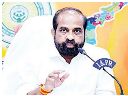
పట్టణ ప్రాథమిక ఆరోగ్య కేంద్రాల్లో సేవల్ని మరింత చేరువ చేసేందుకు ఇటీవల 2600 మంది డాక్టర్లు, పారా మెడికల్ సిబ్బందిని నియమించామని, మరో 110 మంది డాక్టర్లను త్వరలో నియమించేందుకు చర్యలు తీసుకున్నామని మంత్రి సభకు తెలిపారు. వ్యక్తి ఆధారంగా (ఎలెక్టివ్ హెల్త్ రికార్డు) ముందు ఆరోగ్య సంరక్షణా చర్యల్ని(ప్రివెంటివ్ హెల్త్ కేర్) చేపట్టాలన్న ఉద్దేశంతో ముఖ్యమంత్రి శ్రీ నారా చంద్రబాబు

ప్రజాభివృద్ధిని, అమరావతి : రాష్ట్రంలో రూ. 194 కోట్ల వ్యయంతో 100 ప్రాథమిక ఆరోగ్య కేంద్రాల(పిహెచ్సీలు) నిర్మాణం జరుగుతోందని చైద్యారోగ్య శాఖ మంత్రి శ్రీ సత్యకుమార్ యాదవ్ తెలిపారు. రాష్ట్రంలో ఇప్పటికే 1144 ప్రాథమిక ఆరోగ్య కేంద్రాల(పిహెచ్సీలు) పనిచేస్తున్నాయని, వాటికి సొంత భవనాలున్నాయని మంత్రి తెలిపారు. మరో 88 పీహెచ్సీలను మంజూరు చేశామని, వాటి నిర్మాణాలు వివిధ దశల్లో ఉన్నాయని చెప్పారు. శాసన మండలిలో మంగళవారం ప్రాథమిక ఆరోగ్య కేంద్రాల భవనాలకు సంబంధించి పలువురు సభ్యులడిగిన ప్రశ్నలకు మంత్రి సమాధానం చెప్పారు. 12 పీహెచ్సీలకు కొత్త భవనాలు అవసరమని గుర్తించామని, ఆ దిశగా చర్యలు తీసుకుంటున్నామని తెలిపారు. గ్రామీణ పేదలకు విస్తృతమైన వైద్య సేవల్ని అందించేందుకు ప్రాథమిక ఆరోగ్య కేంద్రాల్ని మరింత పటిష్ఠం చేశామన్నారు. 976 పీహెచ్సీ భవనాలకు పూర్తి స్థాయిలో రిపేరు చేపట్టామని, అలాగే 152 కొత్త పీహెచ్సీల్లో మౌలిక సదుపాయాల కల్పనకు చర్యలు తీసుకున్నామని మంత్రి వివరించారు. త్వరలో 110 మంది డాక్టర్ల నియామకం గ్రామీణ ప్రాంతాల్లో 1144 పీహెచ్సీలు, పట్టణ ప్రాంతాల్లో 560 యుపిహెచ్సీలు ఉన్నాయని మంత్రి తెలిపారు. గ్రామీణ,