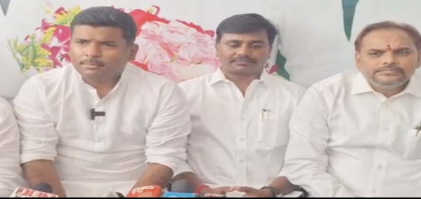
ప్రజా భూమి ప్రతినిధి కిర్లంపూడి

ఎన్నికల్లో ఇచ్చిన హామీలు నెరవేర్చలేని కూటమి. నిరుద్యోగ భృతి ఇస్తానన్న చంద్రబాబు నాయుడు.. 50 సంవత్సరాలకే పెన్షన్ మంజూరు చేస్తానన్న కూటమి ప్రభుత్వం. కూటమి ప్రభుత్వం ఇచ్చిన హామీలు నీటి మూటలే... మాజీ మంత్రి గుడివాడ అమర్నాథ్