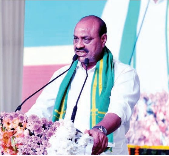
తప్పించుకునే ప్రయత్నాలు ఎంత చేసినా నిజం దాగదని, బాధ్యులపై కఠిన చర్యలు తప్పవని ఆచ్చెన్నాయుడు స్పష్టం చేశారు.

ఆరోపణలు తీసుకురావడం, నిజాలను వక్రీకరించడం అత్యంత ఖండనీయం అని పేర్కొన్నారు. ఆధారాలు లేని ఆరోపణలతో ప్రజల విశ్వాసాన్ని దెబ్బతీయాలనుకోవడం రాజకీయ దిగజారుడుతనం అని విమర్శించారు. హెరిటేజ్ ఇమ్ప్రూవ్మెంట్ వైసీపీ చేస్తున్న ఆరోపణలకు ఒక్క ఆధారం అయినా చూపించగలరా? అని మంత్రి సూటిగా ప్రశ్నించారు. కల్తీతో ఎలాంటి సంబంధం లేని హెరిటేజ్ సంస్థ పేరును లాగడం ద్వారా అసలు అంతం నుంచి ప్రజల దృష్టిని మళ్లించాలనే ప్రయత్నం చేస్తున్నారని అన్నారు. ఆధారాలేని ఆరోపణలు చేసే చట్టపరంగా, నైతికంగా సమాధానం చెప్పాల్సిందే అని హెచ్చరించారు. అదే విధంగా, వైపి జగన్ మోహన్ రెడ్డి తిరుమల శ్రీవారి ఆలయానికి వెళ్లి డిజ్కంపెన్ ఎందుకు ఇవ్వడం లేదు? అని మంత్రి ప్రశ్నించారు. హిందూ సంప్రదాయాలపై మాట్లాడే నైతిక హక్కు వైసీపీకి లేదని, ఎందుకంటే హిందువుల మనోభావాలను దెబ్బతీసింది ఎవరో రాష్ట్ర ప్రజలందరికీ స్పష్టంగా తెలుసు అని వ్యాఖ్యానించారు. తిరుమల తిరుపతి దేవస్థానాలు వంటి పవిత్ర సంస్థల ప్రతిష్ఠను దెబ్బతీయడానికి వైసీపీ చేస్తున్న ప్రయత్నాలను ప్రజలు ఎప్పటికీ క్షమించరని మంత్రి హెచ్చరించారు. తిరుమల లడ్డా ప్రసారంలో కల్తీ జరిగిందని ఒప్పుకున్న వాస్తవం నుంచి