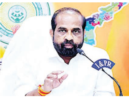
పట్టణ ప్రాథమిక ఆరోగ్య కేంద్రాల్లో సేవల్ని మరింత చేరువ చేసేందుకు ఇటీవల 2600 మంది డాక్టర్లు, పారా మెడికల్ సిబ్బందిని నియమించామని, మరో 110 మంది డాక్టర్లను త్వరలో నియమించేందుకు చర్యలు తీసుకున్నామని మంత్రి సభకు తెలిపారు. వ్యక్తి ఆధారంగా (ఎలెక్టివ్ హెల్త్ రికార్డు) ముందు ఆరోగ్య సంరక్షణా చర్యల్ని(ప్రివెంటివ్ హెల్త్ కేర్) చేపట్టాలన్న ఉద్దేశంతో ముఖ్యమంత్రి శ్రీ నారా చంద్రబాబు

ప్రజాభివృద్ధిని, అమరావతి : రాష్ట్రంలో రూ. 194 కోట్ల వ్యయంతో 100 ప్రాథమిక ఆరోగ్య కేంద్రాల(పిహెచ్సీలు) నిర్మాణం జరుగుతోందని చైద్యారోగ్య శాఖా మంత్రి శ్రీ సత్యకుమార్ యాదవ్ తెలిపారు. రాష్ట్రంలో ఇప్పటికే 1144 ప్రాథమిక ఆరోగ్య కేంద్రాలు(పిహెచ్సీలు) పనిచేస్తున్నాయని, వాటికి సొంత భవనాలున్నాయని మంత్రి తెలిపారు. మరో 88 పీహెచ్సీలను మంజూరు చేశామని, వాటి నిర్మాణాలు వివిధ దశల్లో ఉన్నాయని చెప్పారు. శాసన మండలిలో మంగళవారం ప్రాథమిక ఆరోగ్య కేంద్రాల భవనాలకు సంబంధించి పలువురు సభ్యులడిగిన ప్రశ్నలకు మంత్రి సమాధానం చెప్పారు. 12 పీహెచ్సీలకు కొత్త భవనాలు అవసరమని గుర్తించామని, ఆ దిశగా చర్యలు తీసుకుంటున్నామని తెలిపారు. గ్రామీణ పేదలకు విస్తృతమైన వైద్య సేవల్ని అందించేందుకు ప్రాథమిక ఆరోగ్య కేంద్రాల్ని మరింత పటిష్ఠం చేశామన్నారు. 976 పీహెచ్సీ భవనాలకు పూర్తి స్థాయిలో రిపేరు చేపట్టామని, అలాగే 152 కొత్త పీహెచ్సీల్లో మౌలిక సదుపాయాల కల్పనకు చర్యలు తీసుకున్నామని మంత్రి వివరించారు. త్వరలో 110 మంది డాక్టర్ల నియామకం గ్రామీణ ప్రాంతాల్లో 1144 పీహెచ్సీలు, పట్టణ ప్రాంతాల్లో 560 యుపిహెచ్సీలు ఉన్నాయని మంత్రి తెలిపారు. గ్రామీణ,