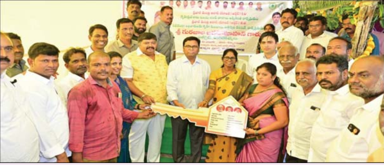
ప్రజాభూమి ప్రతినిధి - చిత్తూరు: