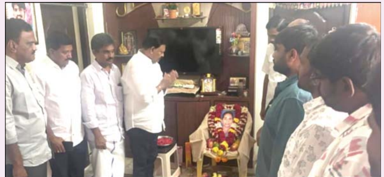
ప్రజాభూమి ప్రతినిధి - వాకాడు