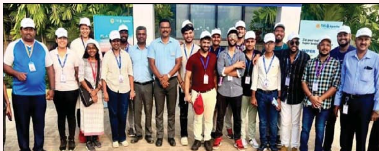
జాగృతి యాత్రా బృందానికి చెందిన 525 మంది సభ్యులు గురువారం సాయంత్రం శ్రీనిధీని సందర్శించారు.