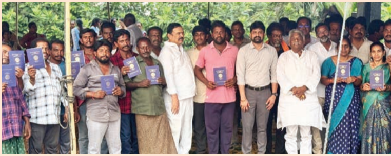
గంగంపాలెం, తాగూర్ పాలెం త్రాగునీటి సమస్య పరిష్కారంకాని అధికారులను ఆదేశించిన ఎమ్మెల్యే