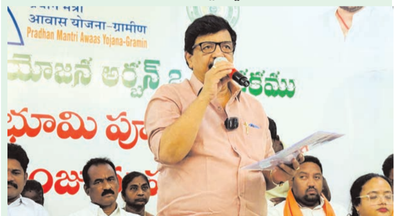
ప్రజా భూమి ప్రతినధి-నిడదవోలు