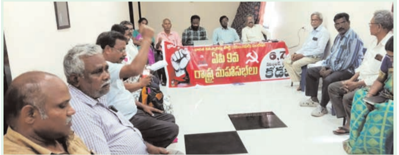
ప్రజా భూమి ప్రతినధి-ఏలేళ్లకం

-సీపిఐ లిబరేషన్ పార్టీ రాష్ట్ర కమిటీ కార్యదర్శి బుగట బంగారాపు పిలుపు