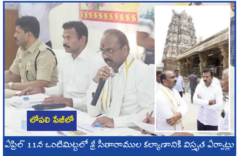
ఎప్రిల్ 11న ఒంటిమిట్టలో శ్రీ సీతారాముల కల్యాణానికి విస్తృత ఏర్పాట్లు