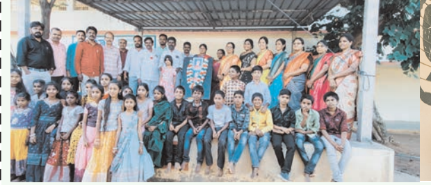
ప్రజా భూమి, కామవరపుకోట