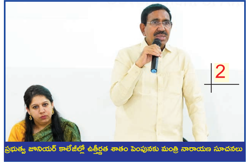
ప్రభుత్వ జూనియర్ కాలేజీలో ఉత్తీర్ణత సాతం పెంపునకు మంత్రి నారాయణ సూచనలు