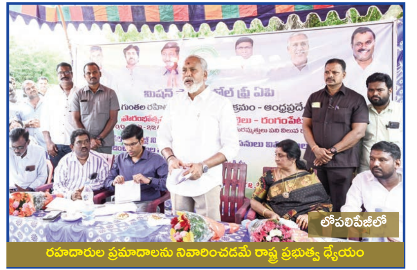
రహదారుల ప్రమాదాలను నివారించడమే రాష్ట్ర ప్రభుత్వ వ్యయం