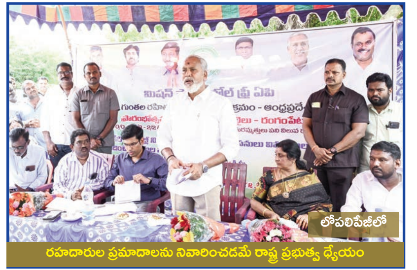
రహదారుల ప్రమాదాలను నివారించడమే రాష్ట్ర ప్రభుత్వ వ్యయం