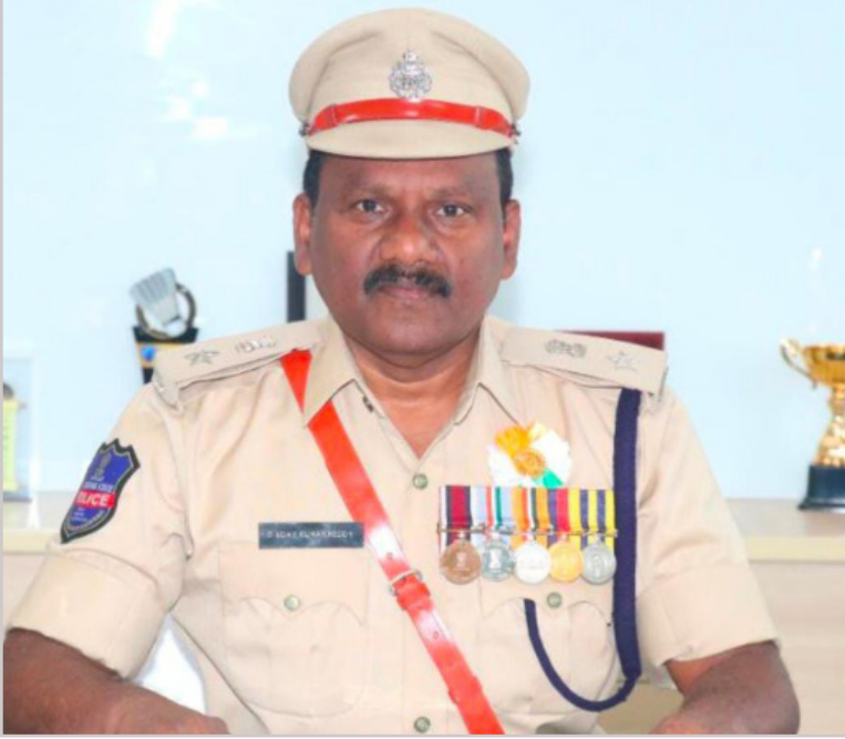
సంబంధించి ఎవరైనా తప్పుడు ప్రచారాలు చేసి వారి పై పూర్తి విచారణ చేపట్టి అందుకు కారణం అయిన వ్యక్తులపై చట్టపరమైన చర్యలు తీసుకుంటామన్నారు.