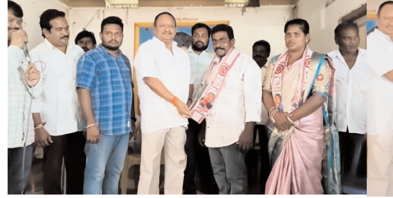
ప్రజాభూమి ప్రతినిధి ఏలేశ్వరం