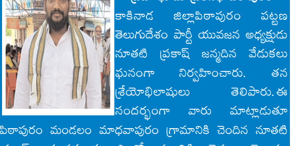
ప్రజాభూమి ప్రతినిధి పిఠాపురం