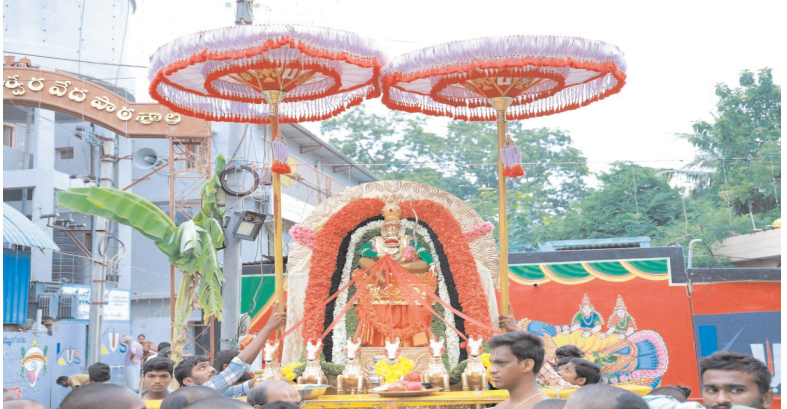
ప్రజాభూమి, తిరుపతి రూరల్

తుమ్మల గుంట శ్రీ కల్యాణ వేంకటేశ్వర స్వామి వారి బ్రహ్మోత్సవాలు అంగరంగ వైభవంగా సాగుతున్నాయి. బ్రహ్మోత్సవాలలో ఏడవరోజు శ్రీ కల్యాణ వేంకటేశ్వర స్వామి వారు అనంత తేజోమయుడుగా సూర్యప్రభ వాహనంపై భక్తులకు దర్శనమిచ్చారు. బ్రహ్మోత్సవాలలో ప్రతి ప్లాత్యకమైన సూర్య ప్రభ వాహన విశిష్టతను ఇప్పుడు తెలుసుకుందాం. సప్తమి - సూర్యప్రభ వాహనం హిందూ సంప్రదాయం ప్రకారం సప్తమి తిథి సూర్య భగవానుని ఆరాధనకు శ్రేష్టమైంది. అక్టోబర్ 10 వ తేదీ గురువారం సూర్యోదయ సమయాన ఆశ్వియుజ సప్తమి తిథి ఉన్నందున శ్రీనివాసునికి సూర్య ప్రభ వాహనం సేవ జరుగుతుంది. శ్రీనివాసుడే సూర్యనారాయణుడువలన కవచం ధరించి ఉదయ భానుని కిరణాలు ప్రసరిస్తుండగా గ్రామంలో ఊరేగుతూ సూర్య మండలం మధ్యనున్న నారాయణమూర్తిని నేనే అని భక్తులకు ప్రభోదించడమే ఈ వాహనం సేవ పరమార్థం.