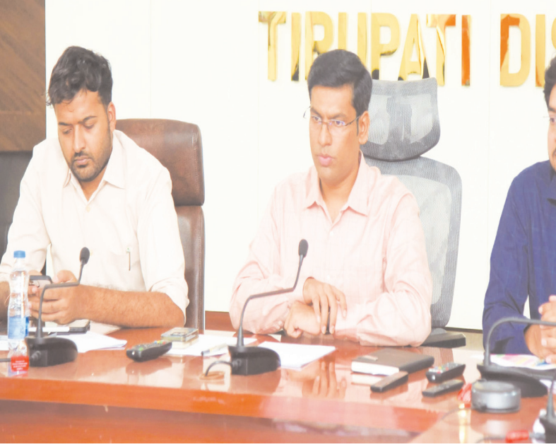
ప్రజాభూమి, తిరుపతి టౌన్

పల్లె పండుగ.. పంచాయతీ వారోత్సవాల ఘనంగా నిర్వహించాలని రాష్ట్ర ఉప ముఖ్యమంత్రి కొణిదెల పవన్ కల్యాణ్ తెలిపారు. మంగళవారం అమరావతి సచివాలయం నుండి జిల్లా కలెక్టర్తో ఈనెల 14 నుండి 20 వరకు జిల్లాలలో నిర్వహించే పల్లె పండుగ- పంచాయతీ వారోత్సవాల నిర్వహణపై వీడియో కాన్ఫరెన్స్ నిర్వహించారు. తిరుపతి జిల్లా నుంచి కలెక్టర్