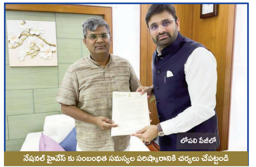
నేషనల్ హైవేస్ కు సంబంధిత సమస్యల పరిష్కారానికి చర్యలు చేపట్టండి