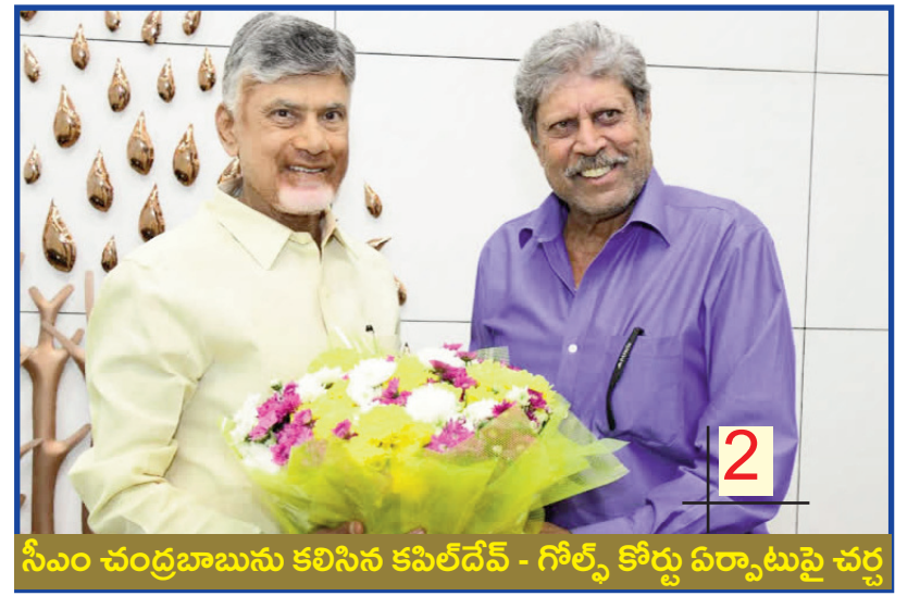
సీఎం చంద్రబాబును కలిసిన కపిల్దేవ్ - గోల్డ్ కోర్సు ఏర్పాటుపై చర్చ