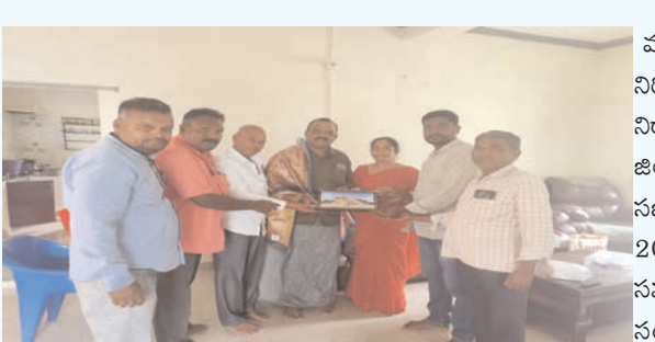
ప్రజా భూమి, లేపాక్షి