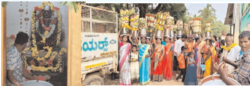
ప్రజా భూమి, లేపాక్షి

మండల పరిధిలోని ఎం వెంకటాపురం గ్రామంలో గ్రామ దేవతలు మహేశ్వరమ్మ, గురుమూర్తి స్వాముల మండల పూజా కార్యక్రమం మంగళవారం ఘనంగా నిర్వహించారు. ఈ ఆలయాల్లో స్వాముల వారి విగ్రహాలను ప్రతిష్ఠించి 41 రోజులు పూర్తయ్యాయి. దీంతో రెండు రోజులుగా గ్రామ దేవత మహేశ్వరమ్మ ఆలయంలో వివిధ హోమాలను నిర్వహించారు. రెండవ రోజు మంగళవారం మహేశ్వరమ్మ, గురుమూర్తి స్వాములకు అభిషేక అర్చనలు నిర్వహించారు. అనంతరం వివిధ రకాల పుష్పాలతో స్వామివారి విగ్రహాలను అందంగా అలంకరించారు. మహేశ్వరమ్మకు కుంకుమార్చన పూజా కార్యక్రమాన్ని నిర్వహించారు. అనంతరం స్వామివార్లకు ప్రత్యేక పూజలు నిర్వహించారు. భక్తజన సందోహం మధ్యన జరిగిన పూజా కార్యక్రమం కన్నుల పండుగగా సాగింది. అనంతరం ఉపవాస దీక్షతో మహిళలు ప్రత్యేకంగా అలంకరించిన జ్యోతులను ఇంటి నుండి గ్రామ వీధుల గుండా ఆలయానికి భక్తి శ్రద్ధలతో తీసుకువచ్చి స్వామివార్లకు అర్పించారు. అనంతరం మహిళలు స్వామివార్లకు విశేష పూజలు నిర్వహించారు. ఈ కార్యక్రమంలో ఎం వెంకటాపురం గ్రామస్థులతో పాటు మట్టుపక్కల ఉన్న గ్రామాల నుండి భక్తులు అధిక సంఖ్యలో మండల పూజలో పాల్గొన్నారు.